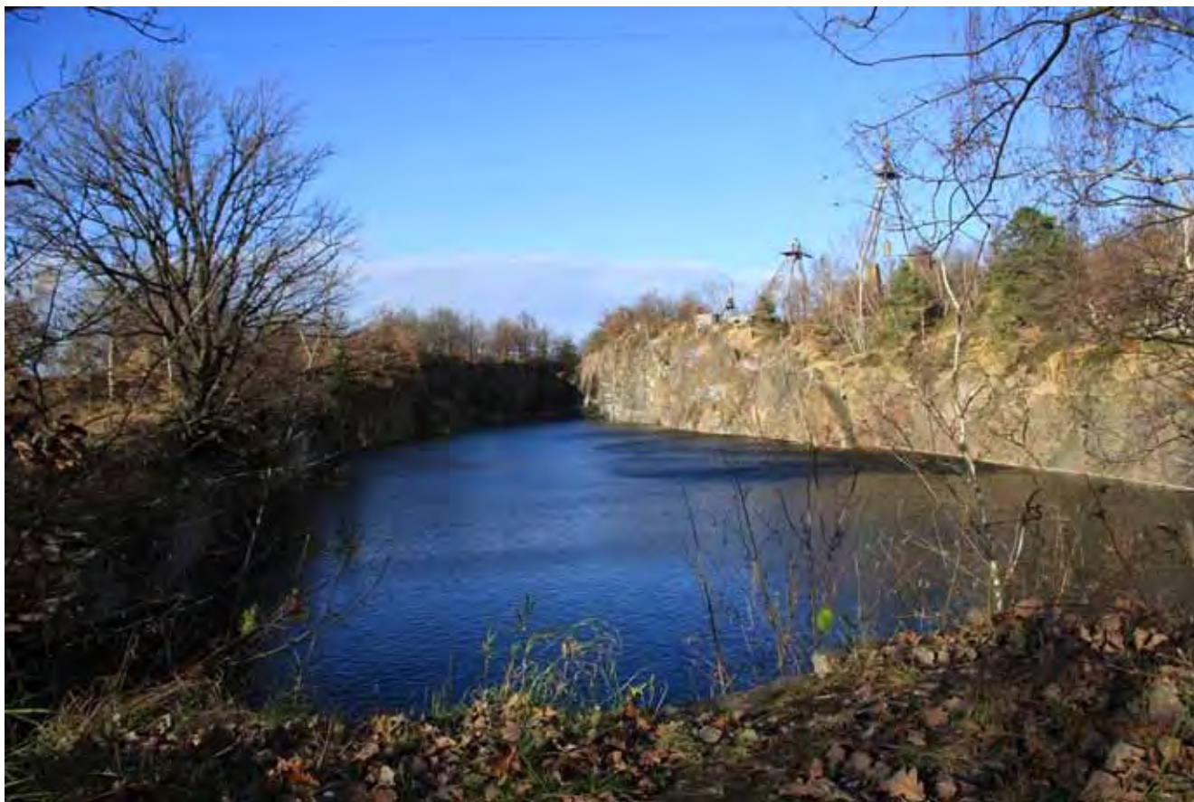
Fig. 9. Widok na kamieniołom w Chwałkowie • General view of the Chwałków quarry