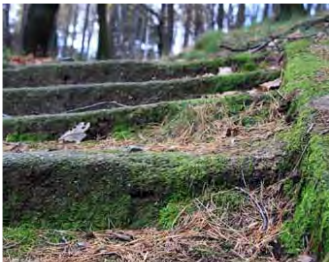
Fig. 6. Schody prowadzące do kamieniołomu „Harcerskiego” • Stairs to the “Scout Quarry”

Jeszcze inną grupą, z powodzeniem korzystającą z możliwości jakie daje kamieniołom, są pasjonaci nurkowania. Szczególną atrakcją przyciągającą ich właśnie w to miejsce jest możliwość oglądania na znacznej głębokości pozostawionego na dnie kamieniołomu górniczego sprzętu, maszyn, narzędzi itp.