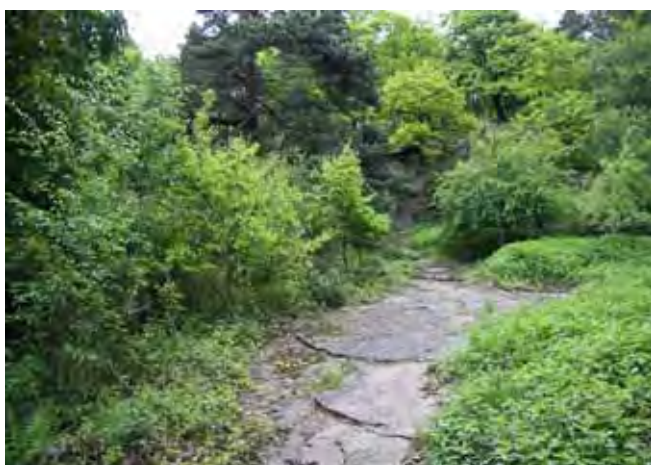
Fig. 2. Granitowa ściana Kamieniołomu Harcerskiego, fot. M.W. Lorenc • Granite wall in the “Scout Quarry”, phot. M.W. Lorenc

Funkcje nieczynnych kamieniołomów w krajobrazie mogą być różne, jednakże w większości przypadków uzależnione są od fizjografii terenu, a co się z tym wiąże od lokalizacji, rodzaju wydobywanej kopaliny, indywidualnego charakteru oraz od historii wyrobiska. Warto w tym miejscu wspomnieć, że kamieniołomy jako wyrobiska górnicze wchodzą w skład szeroko pojętego dziedzictwa górniczego, a ono na świecie rozpatrywane jest jako dziedzictwo kulturowe i bywa wpisywane na Listę Światowego Dziedzictwa Kulturowego i Przyrodniczego UNESCO (Lorenc, 2010; Lorenc, Janusz, 2010; Lorenc, Cocks, 2008; Pérez Sánchez, Lorenc, 2008).