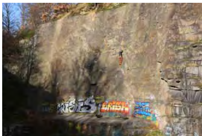
Fig. 8. Miłośnik wspinaczki górskiej na ścianie kamieniołomu w Chwałkowie, fot. E. Krawczyk • Mountaineers climbing the wall in the Chwałków quarry, phot. E. Krawczyk

o różnych zainteresowaniach mogą w takich miejscach mieć szansę na rozwijanie swoich pasji. Warto więc wykorzystać takie możliwości i pozwolić na realizację poszczególnych zainteresowań w sposób formalny i zorganizowany. Nie ma bowiem żadnych przeszkód, aby kwestie te rozwiązać prawnie i poszczególne, nadające się do tego kamieniołomy odpowiednio przystosować do obsługi zarówno okolicznych mieszkańców, jak też turystów. Mogłyby w ten sposób powstać atrakcyjne miejsca niecodziennej formy spędzenia wolnego czasu, które, przy odpowiedniej organizacji, równocześnie powiększyłyby ofertę turystyczną w regionie, dając przy okazji wymierne wpływy do budżetu gminy.