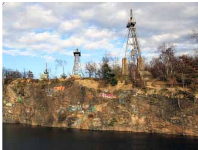
Fig. 7. Skalna ściana opuszczonego kamieniołomu w Chwałkowie, fot. E. Krawczyk • Wall of abandoned granite quarry in Chwałków, phot. E. Krawczyk