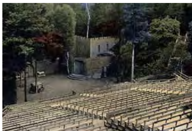
Fig. 3. Amfiteatr usytuowany w prehistorycznym kamieniołomie • The amphitheater located in historical quarry

W latach siedemdziesiątych XX wieku powstały nieicne projekty, które pozwoliły na zagospodarowanie dawnych wyrobisk. Były to między innymi Kadzielnia w Kielcach, Sobótka, Góra Św. Anny (Pietrzyk-Sokulska 2003).