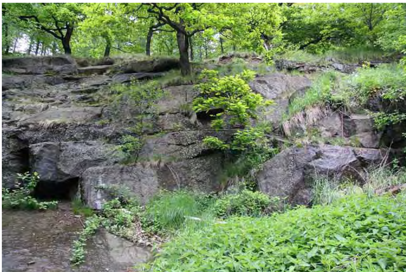
Fig. 5. Zarośnięty Kamieniołom Harcerski, fot. M.W. Lorenc • The “Scout Quarry” covered with vegetation, phot. M.W. Lorenc