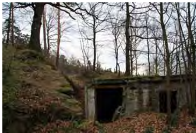
Fig. 4. Ruiny po zabudowie scenicznej amfiteatru • Remains of stage construction in the amphitheatre

W latach 1925–1926, w nieczynnym już od dawna wyrobisku, został wybudowany amfiteatr (Fig. 3), w którym aż do 1945 r. odbywały się liczne spotkania i imprezy plenerowe. Na początku 1945 r. amfiteatr ten został rozebrany przez wojska hitlerowskie na materiał do budowy linii obronnych.