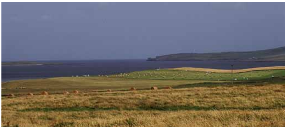
Fig. 5. Wnętrze wysp orkadzkich stanowią płaskie lub słabo nachylone obszary dewońskich piaskowców Old Red, będących podłożem rozwoju żyznych gleb (Mainland), fot. A. Latocha • The inner parts of the Orkney are flat or slightly inclined surfaces of Devonian Old Red sandstone, on which the fertile soils are developed (Mainland), phot. A. Latocha