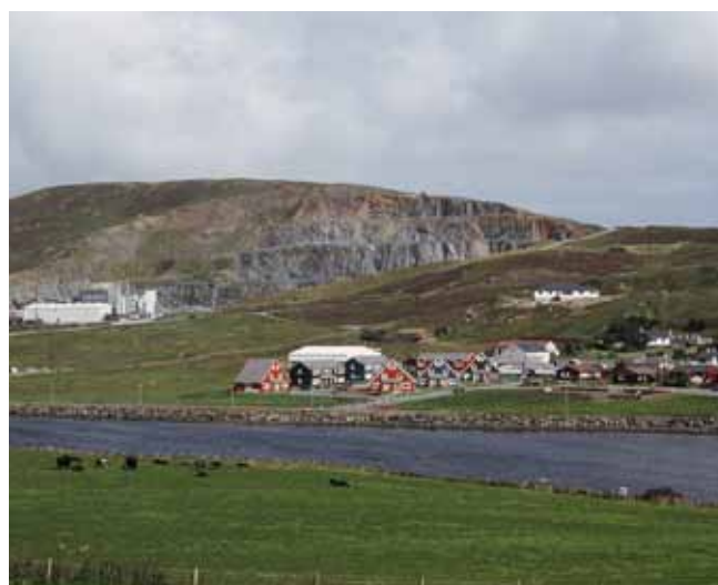
Fig. 4. Zróżnicowana budowa geologiczna decyduje o bogatych złożach surowców skalnych Szetlandów. Eksploatacja kruszywa w okolicy Scalloway (Szetlandy) • Diversified geology is responsible for the variety of valuable industrial stones deposits. Aggregate exploitation near Scalloway (Shetland)