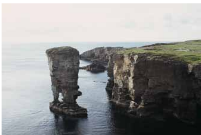
Fig. 8. Piaskowcowy ostaniec abrazyjny, Zamek Yesnaby (Orkady), stoi na cokole ze skał wulkanicznych • Sandstone abrasional stack, the Yesnaby Castle (Orkney) stands on the basement of volcanic rocks

na Orkadach liczne obiekty z epok neolitu, brązu i żelaza, wznoszone właśnie z piaskowca łupkowatego. Najbardziej spektakularnym przykładem jest neolityczna wioska Skara Brae (najlepiej zachowana osada epoki kamiennej w Europie), gdzie w dawnych kamiennych chatkach przykrytych wydmowymi piaskami przetrwały nawet neolityczne "meble". Stanowią je odpowiednio ułożone głązy i bloki piaskowca płytowego, tworzące kredensy, łóżka, zbiorniki na wodę czy obudowę palenisk (Bailey, 1995) (Fig. 11). Z piaskowców tych w okresie neolitu wznoszono także kultowe kamienne kręgi i stojące kamienie (m.in. w Stenness, Brodgar; Fig. 12) oraz grobowce komorowe, których naliczono na Orkadach ponad 80, w tym największy, Maes Howe, datowany na 2900-2800 lat p.n.e. Budujące go bloki skalne ważą do 3 ton, a płyty piaskowcowe pozwoliły na konstrukcję kopuły z zachodzących na siebie ku górze płyt. W późniejszych czasach dewońskie piaskowce płytowe stały się dla orkadzkich farmerów idealnym budulcem ogrodzeń, zagród i domostw (McCarthy, 1994). Z kolei mniej odporne odmiany piaskowców dewońskich ulegają szybkiemu wietrzeniu w morskim klimacie wysp, co między innymi przejawia się znacznymi zniszczeniami zbudowanych z nich zabytków (Fig. 13).