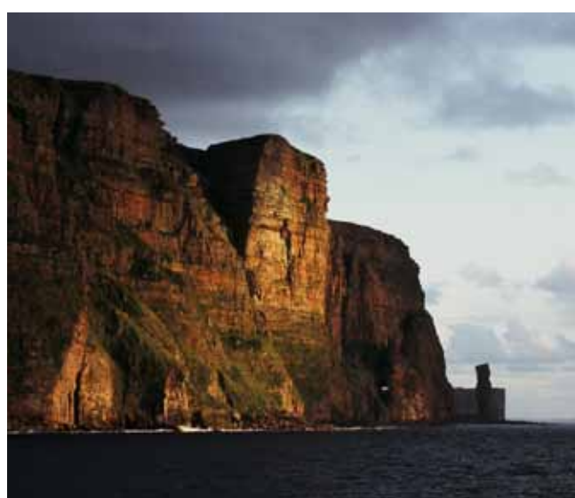
Fig. 9. Klifowe wybrzeża wyspy Hoy (Orkady) powstałe w górnodewońskich piaskowcach. W tle widoczny słynny, izolowany słup skalny Old Man of Hoy (wysokość 33,5 m) • Cliffs of the Hoy Island (Orkney) are formed of Upper Devonian sandstones. In the far ground the Old Man of Hoy is visible – the famous, isolated rock pillar, standing 33.5 m above sea surface

Kolejnym ważnym okresem w dziejach geologicznych Orkadów i Szetlandów był ponowny wzrost naprężeń w skorupie ziemskiej i intensyfikacja ruchów tektonicznych,