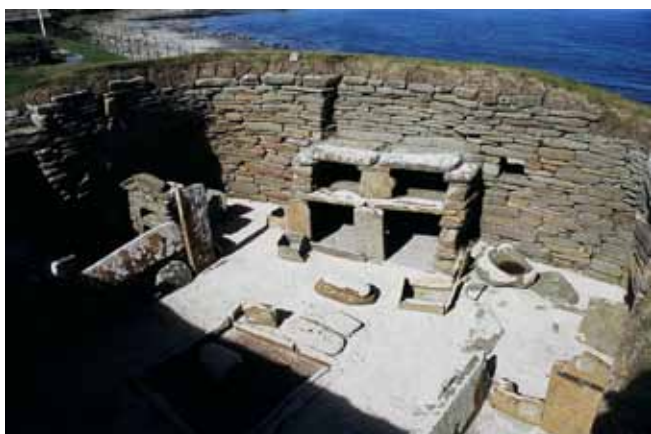
Fig. 11. Wnętrze neolitycznej chaty w Skara Brae (Orkady). Kamienne "meble" wykonane są z piaskowca płytowego • The interior of a Neolithic cottage in Skara Brae (Orkney). Stony furniture is made of flagstone