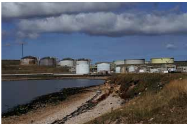
Fig. 14. Sullom Voe (Szetlandy) – największy w Europie terminal ropy naftowej i gazu ziemnego • Sullom Voe (Shetland) – the largest oil and gas terminal in Europe

ryftowa w obrębie rozpadającego się w wyniku naprężeń tensyjnych kontynentu, która zapoczątkowała powstanie Oceanu Atlantyckiego. Jego otwarcie nastąpiło ostatecznie w późnej kredzie. Efektem stopniowego, tensyjnego rozciągania i ścieniania skorupy ziemskiej było uaktywnienie działalności wulkanicznej. Koncentrowała się ona głównie wzdłuż centralnej części nowo powstającego oceanu, czyli wzdłuż Grzbietu Śród atlantyckiego ale aktywność wulkaniczna zaznaczyła się także na obszarach przyległych, czego pozostałością jest między innymi pas wulkanów rozciągający się od wyspy Arran do wyspy Skye u zachodnich wybrzeży Szkocji (McKirdy, Crofts, 1999).