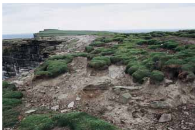
Fig. 20. Działalność fal sztormowych sięga wysoko na powierzchnię klifów, niszcząc pokrywę roślinną (Westray, Orkady), fot. A. Latocha • Destructive action of storm waves reaches the cliff tops, stripping away the vegetation (Westray, Orkney), phot. A. Latocha

wartości naukowej (Sites of Special Scientific Interest, SSSI) (McKirdy, Crofts, 1999). Promocji dziedzictwa geologicznego i geomorfologicznego różnych obszarów Szkocji, w tym także Orkadów i Szetlandów, służy również seria wydawnicza “Krajobraz kształtowany przez geologię” (‘Landscape Fashioned by Geology’), przygotowywana wspólnie przez Scottish Natural Heritage i British Geological Survey. Wyprawa na oba archipelagi może więc być znakomitą, terenową lekcją geologii i geomorfologii – bezpośrednio pod nogami mamy tu skały i formy rzeźby związane z wieloma różnymi, mniej lub bardziej odległymi epokami geologicznymi.