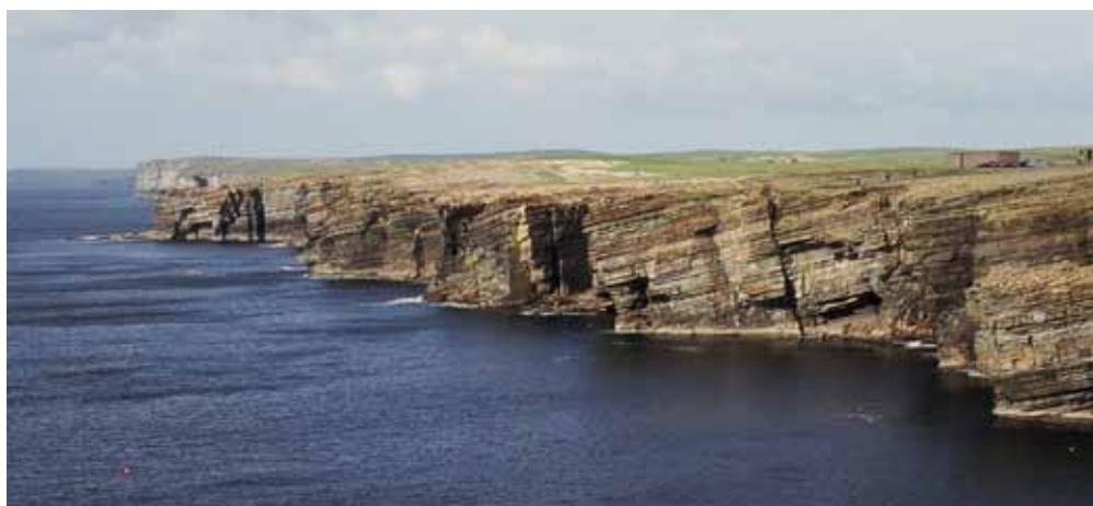
Fig. 6. W klifach w rejonie Yesnaby (Mainland, Orkady) wyraźnie widać strukturę i uławicenie budujących je piaskowców dewońskich • Sedimentary structures of Devonian sandstone are well-visible in the cliffs near Yesnaby (Mainland, Orkney)

Efektem procesów denudacyjnych i akumulacyjnych w dewonie było powstanie rozległej pokrywy skał osadowych, określanych mianem piaskowca Old Red, mających na większości obszaru charakter płyty. Obecnie stanowią one podłoże wszystkich wysp archipelagu Orkadów. W centralnych częściach wysp piaskowce dewonu tworzą jednolite i monotone, płaskie lub lekko faliste powierzchnie (Fig. 5).