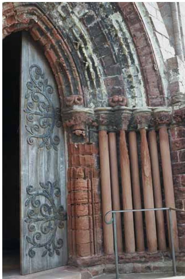
Fig. 13. Wietrzenie piaskowców Old Red w portalu romańskiej katedry Św. Magnusa w Kirkwall (Orkady) • Weathering of the Old Red Sandstone in the portal of the Romanesque St. Magnus Cathedral in Kirkwall (Orkney)

Rów ten utworzony został w permie jako ryft, który zapoczątkował otwarcie współczesnego Morza Północnego. Ostateczne połączenie nowego ryftu z wodami otwartego morza nastąpiło na początku jury. Drugim głównym obszarem występowania skał zbiornikowych węglowodorów jest Niecka Wschodnioszetlandzka. W obu tych rejonach skały zawierające ropę i gaz są różnego wieku, od dewonu do eocenu, jednak główne zasoby węglowodorów występują w osadach środkowojurajskich. W ostatnich latach intensyfikacji uległa również eksploatacja ropy i gazu z szelfu kontynentalnego u zachodnich wybrzeży Szetlandów, gdzie odkryto kilka większych złóż ropooszczędnych. Ropa zawarta w największym z nich, Clair Oilfield, wygenerowana została w łupkach późnojurajskich, a pułapką stał się piaskowiec Old Red, do którego ropa migrowała wzdłuż nieciągłości tektonicznych (Auton i in., 1996).