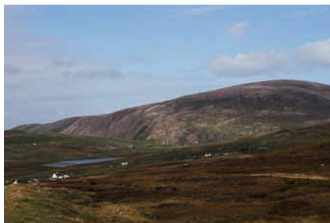
Fig. 3. Ronas Hill - najwyższe wzniesienie Szetlandów (450 m n.p.m.) stanowi intruzję granitową z okresu syluru-dewonu • The Ronas Hill – the highest elevation of the Shetland (450 m a.s.l.) is the Silurian-Devonian granite intrusion