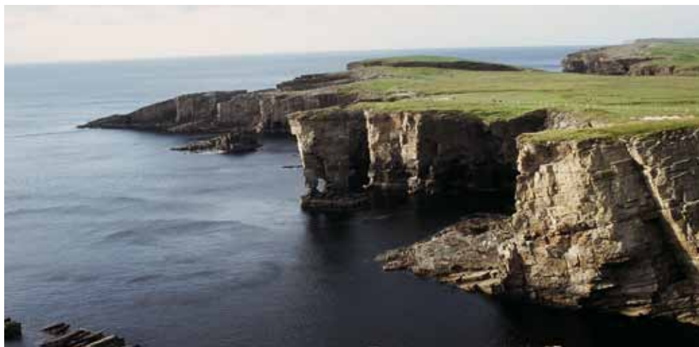
Fig. 7. Klifowe wybrzeże w okolicy Yesnaby (Mainland, Orkady) odznacza się dużym urozmaiceniem i znaczną ilością abrazyjnych form skalnych • The cliffed shoreline near Yesnaby (Mainland, Orkney) is very diverse, with many various abrasional rock features