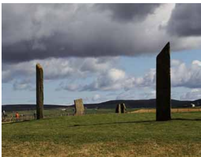
Fig. 12. Piaskowiec płytowy stanowi doskonały i trwały budulec od czasów prehistorycznych. Wykonano z niego m.in. neolityczne megality w Stenness (Orkady) • Flagstone has been a perfect, hard construction stone since the Prehistoric times. It was used, among others, in construction of the Neolithic megaliths in Stenness (Orkney)