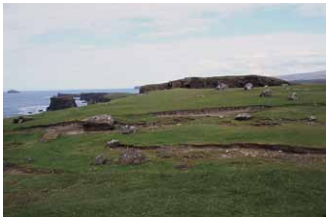
Fig. 19. Głazy wyrzucone przez fale sztormowe na powierzchnię 20-metrowego klifu znajdują się do 80 m w głąb lądu (Eshaness, Szetlandy) • Boulders torn by storm waves onto the cliff top (20 m high) are found up to 80 m inland (Eshaness, Shetland)

nych, przygotowane zostały także ścieżki edukacyjne. Przykładem może być trasa wzdłuż zachodnich wybrzeży Mainland na Orkadach, w okolicach Yesnaby, gdzie przy szlaku ustawiono kilka tablic informacyjnych na temat otaczającego środowiska przyrodniczego. Między innymi przedstawiają one w prosty i przystępny sposób zagadnienia związane z budową geologiczną i etapami rozwoju rzeźby tego obszaru oraz genezą urozmaiconych form skalnych w strefie wybrzeża. Łącznie na Orkadach i Szetlandach znajduje się blisko 50 obszarów objętych ochroną przez Scottish Natural Heritage – niezależną agencją rządową – jako miejsca o szczególnej