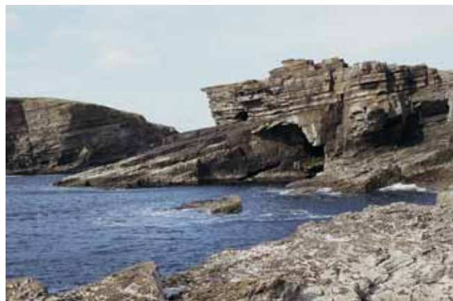
Fig. 18. Platformy abrazyjne w piaskowcach dewońskich nawiązują na ogół do upadu warstw skalnych. Ich nachylenie oraz silne fale oceaniczne nie sprzyjają formowaniu piaszczystych plaż (A – Westray, B – Mainland; Orkady), fot. A. Latocha • Abrasional platforms cut into Devonian sandstones follow the dip of strata. Their inclination together with the power of oceanic storm waves do not support formation of sandy beaches (A – Westray, B – Mainland; Orkney), phot. A. Latocha