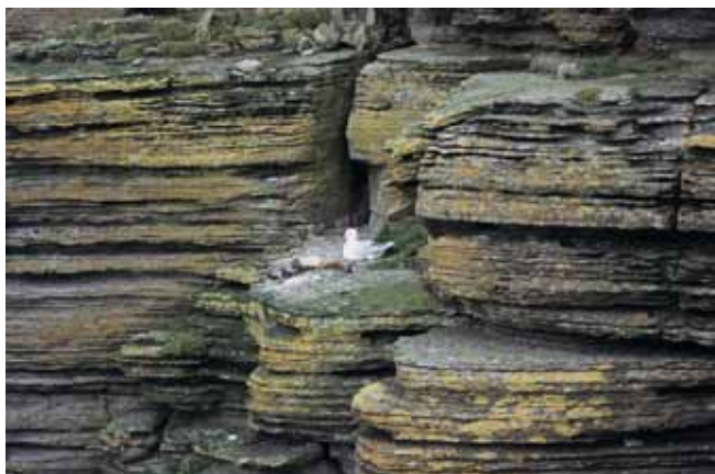
Fig. 10. Selektywne wietrzenie oraz oddzielność piaskowca płytowego sprzyja gniazdowaniu ptaków morskich, dzięki czemu klify stanowią cenne ostoje ptasie (Westray, Orkady) • Selective weathering and fissility of the flagstone slabs facilitate the nesting of seabirds, therefore, many cliffs are important bird sanctuaries (Westray, Orkney)