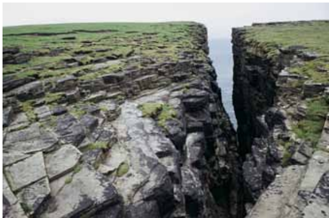
Fig. 17. Oddzielność płytowa piaskowców łupkowych i spękania sprzyjają rozwojowi szczelin na wybrzeżach klifowych. Z czasem przekształcają się one w głęboko wcięte, wąskie zatoki (Westray, Orkady), fot. A. Latocha • Fissility and fracturing of the flagstone favour the development of clefts in the cliffs. With time, such clefts evolve into deeply cut, narrow bays (Westray, Orkney), phot. A. Latocha