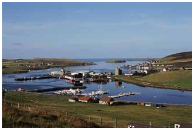
Fig. 15. Liczne, długie i głębokie zatoki morskie u wybrzeży Szetlandów stanowią pozostałości po zlodowaceniach plejstocenijskich. Sprzyjają jednocześnie zakładaniu osad i portów. Dawna stolica Szetlandów – Scalloway • Many long and deep bays along the shores of the Shetland are remnants of Pleistocene glaciations. Such sites facilitate the development of settlements and harbours. Scalloway – the former capital of Shetland

Współczesne procesy rzeźbotwórcze najlepiej obserwować na wybrzeżach. Wiele odcinków wybrzeży nich ma charakter klifów o urozmaiconej rzeźbie, wynikającej ze zróżnicowanych cech litologicznych i strukturalnych budujących je skał (Fig. 16 A, B, C). Wzdłuż linii uskoków i spękań rozwijają się długie i wąskie zatoki o charakterze szczelin (Fig. 17), z