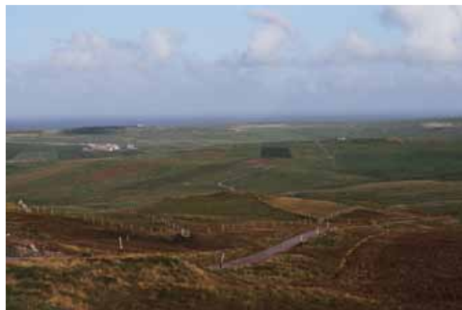
Fig. 2. Silnie zdenudownowane podłoże prekambryjskich skał (formacja Dalradian) tworzy pofalowany krajobraz południowej części Szetlandów, fot. A. Latocha • Strongly denudated Precambrian basement (Dalradian Formation) forms undulating landscape of the southern Shetland, phot. A. Latocha

Okres dewonu odcisnął szczególnie mocne piętno na współczesnym ukształtowaniu rzeźby Orkadów. W okresie tym, około 400 milionów lat temu, obszar dzisiejszych Wysp Brytyjskich położony był około 10° szerokości geograficznej południowej, stąd panujący wówczas klimat miał charakter pustynny (McKirdy, Crofts, 1999). Istniejący tu wtedy górski typ rzeźby sprzyjał intensywnej erozji i denudacji w czasie epizodycznych opadów. W efekcie, w obniżeniach terenu – zarówno suchych, jak i wypełnionych wodami jezior – następowała znaczna akumulacja osadów, przede wszystkim piaszczystych. W tym czasie na obrzeżu gór ukształtował się olbrzymi zbiornik wodny, tzw. Jezioro Orkadzkie, wypełniający obniżenie tektoniczne zwane Niecką Orkadzką (McKirdy, Crofts, 1999). Również w tym zbiorniku następowała intensywna depozycja osadów, zmieniająca się zależnie od fluktuacji linii brzegowej jeziora uzależnionej od znacznych, sezonowych i wieloletnich zmian ilości opadów. Miąższość osadów dewońskich zakumulowanych w tym zbiorniku jeziornym oceniana jest na około 4000 m piasków i ilów (Auton i in., 1996).