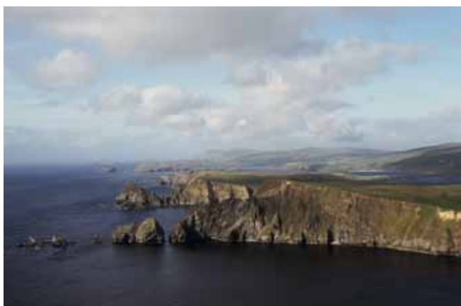
Fig. 16. Urozmaicona linia brzegowa nawiązuje do zróżnicowania litologicznego i litofacjalnego skał budujących klify. Przykłady wybrzeży klifowych: A – w bazaltach (Eshaness, Szetlandy), B – w piaskowcach łupkowych (Westray, Orkady), C – w skałach metamorficznych formacji Dalradian (Mainland, Szetlandy) • Diversified shoreline results from lithological and lithofacial variability of the cliff-forming rocks. Examples of cliffed shores cut in: A – basalts (Eshaness, Shetland), B – flagstone (Westray, Orkney), C – Dalradian Formation metamorphics (Mainland, Shetland)