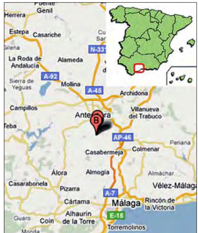
Fig. 1. Lokalizacja Torcal de Antequera • Location of Torcal de Antequera

Torcal de Antequera położony na wysokości 1198 m n.p.m. i zajmujący powierzchnię 20 km 2 zaskakuje swoimi niezwykle formami utworzonymi w wyniku połączenia erozyjnej działalności deszczu, a nawet śniegu oraz wiatru, z mało odpornym na tego typu zjawiska wapieniem. W konsekwencji tego długotrwałego procesu, dziś możemy podziwiać niezliczoną wręcz ilość niezwykle i charakterystycznych form skalnych, które tworzą labirynt dolin i łączących je korytarze, przypominając tym samym formę niezwykle miasta.