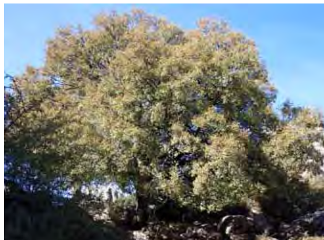
Fig. 5. Wyjątkowo duży okaz klonu ( Acer monpesellanum ), fot. M. Janusz • Extremely big maple ( Acer monpesellanum ), phot. M. Janusz