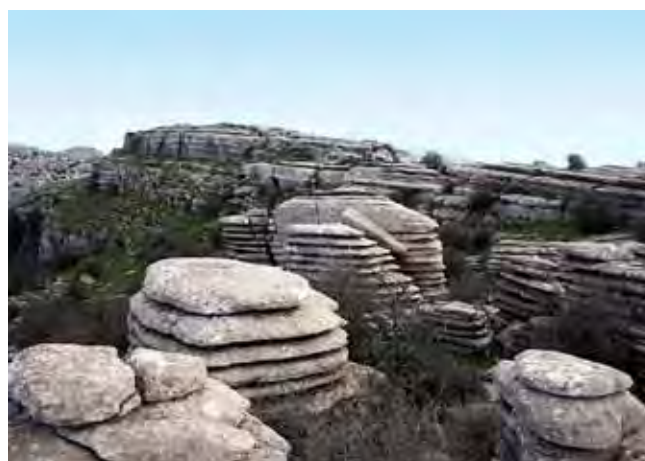
Fig. 13. Skały znane jako stopy talerzy lub monet, fot. M.W. Lorenc • Rocks known as piles of plates or coins, phot. M.W. Lorenc

Obecnie Park Naturalny Torcal de Antequera znajduje się w fazie rozwoju turystycznego. W przyszłości przewidziana jest budowa hotelu na terenie samego parku. Rozbudowano już nawet infrastrukturę zapewniającą wygodny dojazd do strefy wejściowej, przy której utworzono parking oraz centrum turystyczne.