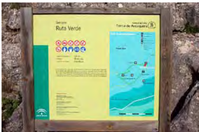
Fig. 10. Panel informacyjny szlaku zielonego • The green-path information panel

Ze względu na wysokie walory przyrodnicze i względnie rzadko współwystępujące ze sobą gatunki roślin, Park Naturalny Torcal de Antequera reprezentuje oryginalny, wręcz unikatowy krajobraz. Dominującym elementem są oczywiście niespotykane formy skał, które wydają się być wyrzeźbione przez niezwykle utalentowanego artystę. Te niepowtarzalne figury geometryczne rozciągają się w większości miejsc aż po horyzont, co sprawia że turysta czuje się jakby przebywał w innym świecie, który w niczym nie przypomina tego znanego na co dzień. Tutaj dominują inne prawa – prawa natury, którym należy się podporządkować. Ściśle