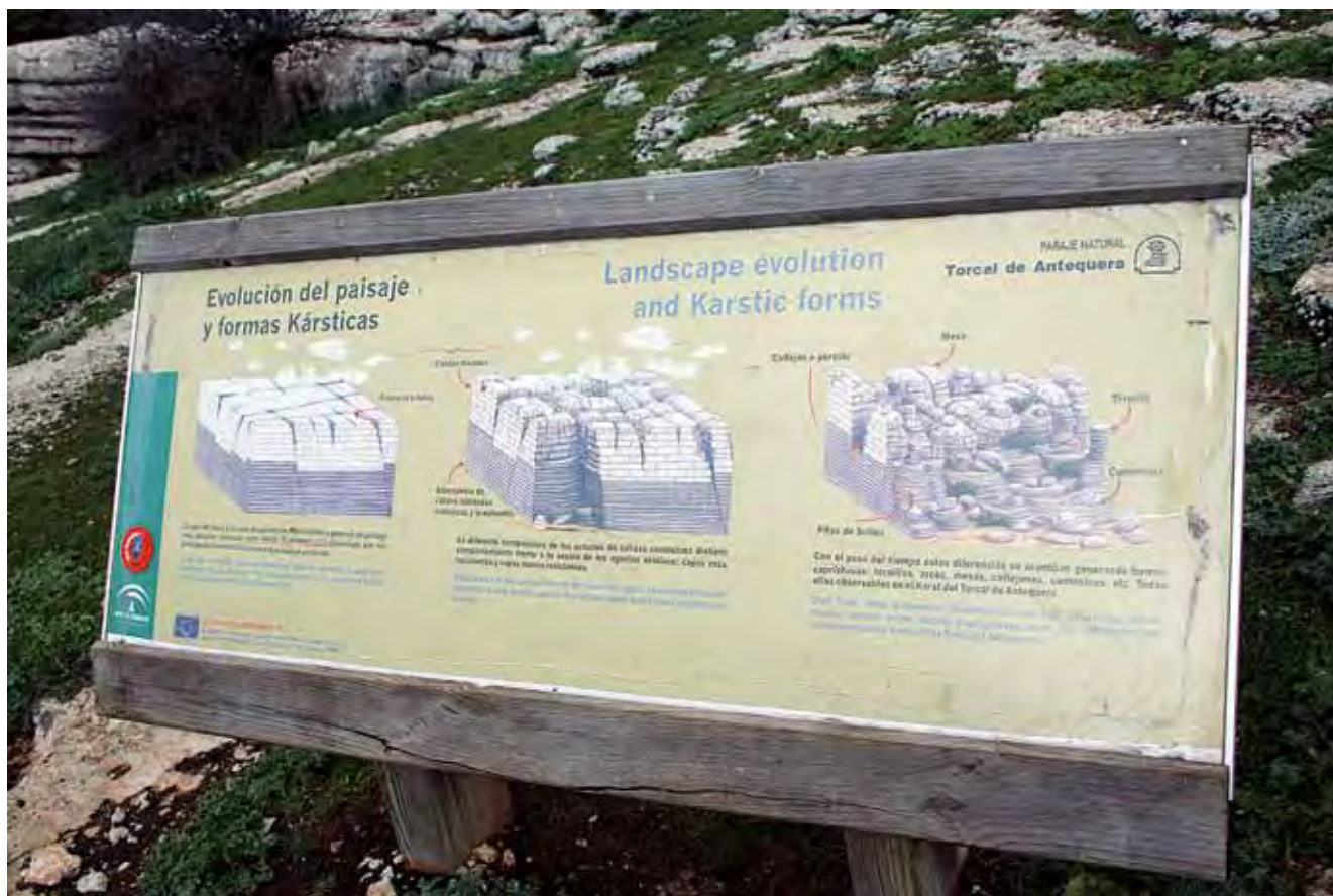
Fig. 11. Panel informacyjny rozwoju procesów krasowych • The karst genesis information panel

Wyraźne są ślady obecności Rzymian, którzy eksploatowali skały Torcal w celu pozyskania wapieni do budowy domów w pobliskich wsiach: Anticaria, Osqua i Nescania. Tereny te znane były również Arabom, którzy podporządkowali sobie znaczną część Hiszpanii na prawie siedem wieków; w Torcal rozpoznano groby datowane na ten właśnie okres.