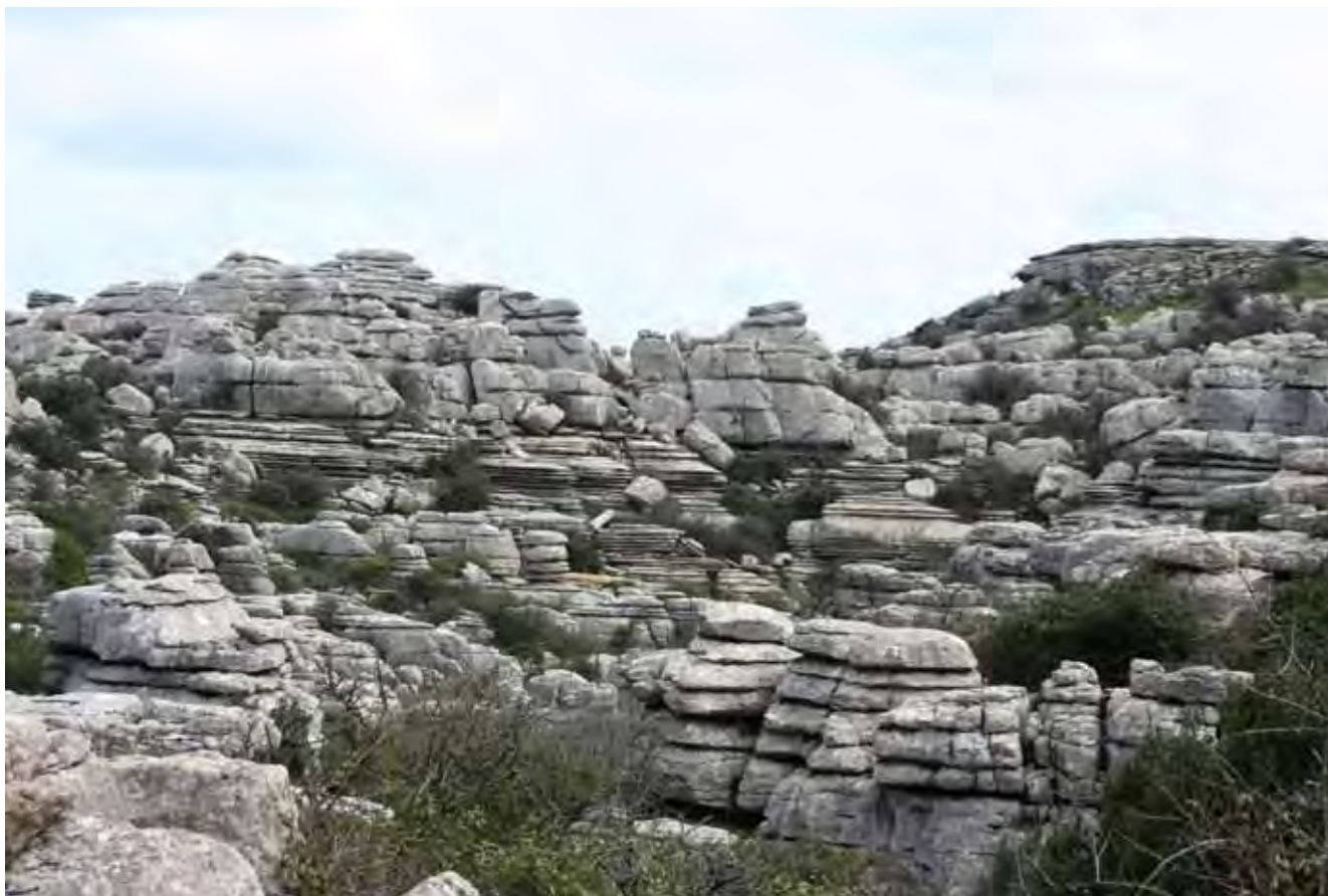
Fig. 2. Strefa wejściowa do Parku Naturalnego Torcal de Antequera • Entrance zone of the Torcal de Antequera Natural Park

Nic więc dziwnego, że nazwa „Torcal de Antequera” zwyczajowo rozumiana też jako „kamienne miasto” lub „kamienne piekło”, używana jest chyba raczej na przekór panującym tu warunkom pogodowym, które szczególnie w zimie odznaczają się wysoką wilgotnością i przyczyniają się do powstawania gęstej mgły, co z kolei przekłada się na wyjątkową, owianą tajemniczością atmosferę tego miejsca (Fig. 2).