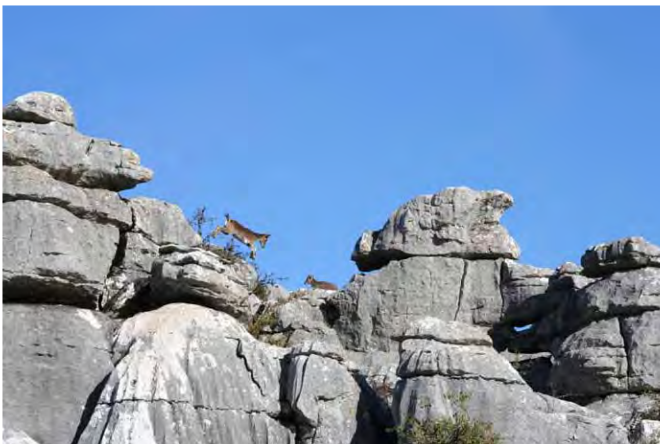
Fig. 6. Kozice na szczycie skał Torcal, fot. M. Janusz • Chamoises on the top of the Torcal rocks, phot. M. Janusz