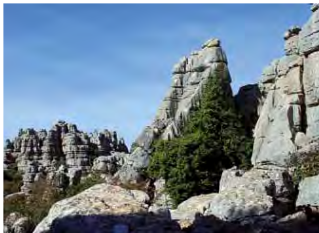
Fig. 7. Regularne ostre formy geometryczne w krajobrazie Torcal • Regular and sharp forms in the Torcal landscape

Wśród ssaków najczęściej spotyka się krety, szczególnie liczne w strefach lejów krasowych, gdzie ich podziemna działalność jest łatwo rozpoznawalna; większość pozostałych gatunków można umiejscowić głównie po ich odchodach, a są to: lisy, borsuki, łasice, króliki i kozice jako