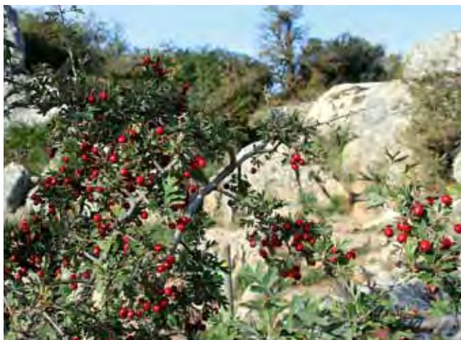
Fig. 4. Głóg ( Crataegus monogyna ) • Hawthorn ( Crataegus monogyna )