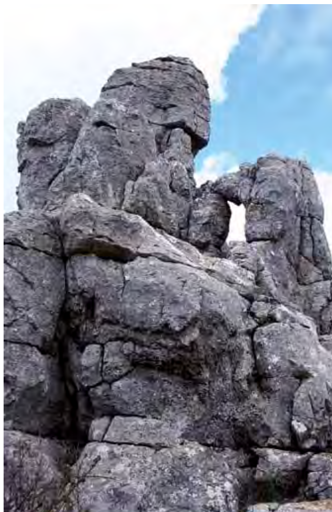
Fig. 8. Niektóre formy skalne przypominają znajome kształty • Some rock-forms sometimes remind well-known shapes

przedstawiciele najbardziej reprezentatywni dla tej okolicy (Fig. 6).