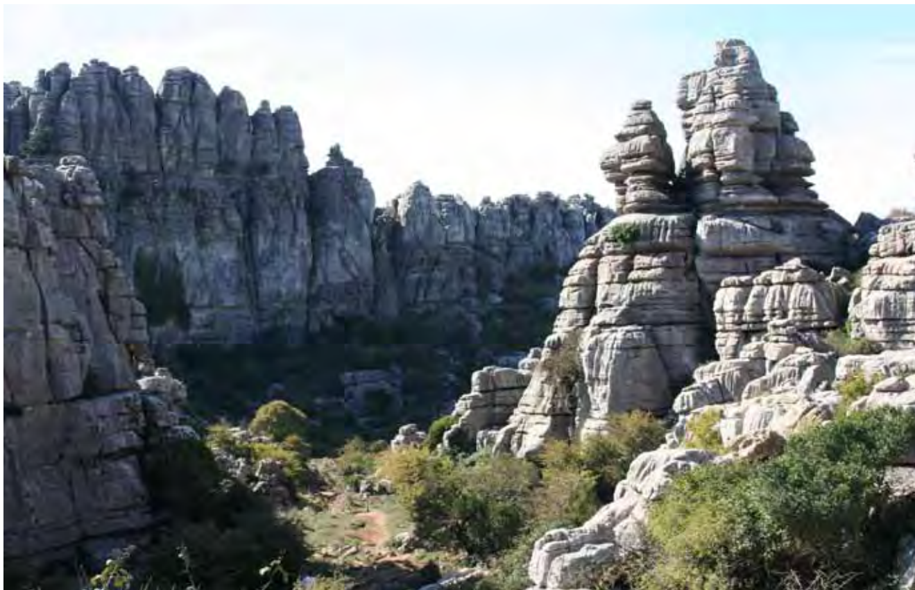
Fig. 3. Krajobraz Torcalu Niskiego • Landscape of the Lower Torcal

Złożone procesy erozyjne doprowadziły do powstania wielu naturalnych form skalnych, bardzo przypominających niektóre figury z życia codziennego, np. śruba – stanowiąca logotyp okolicy, kapelusz, trumna, lornetka, kielich, kość itp. Ponadto, rozpuszczanie skał na poziomie powierzchniowym powoduje powstanie żeber i żłobków krasowych, które trudno pokonywać pieszo.