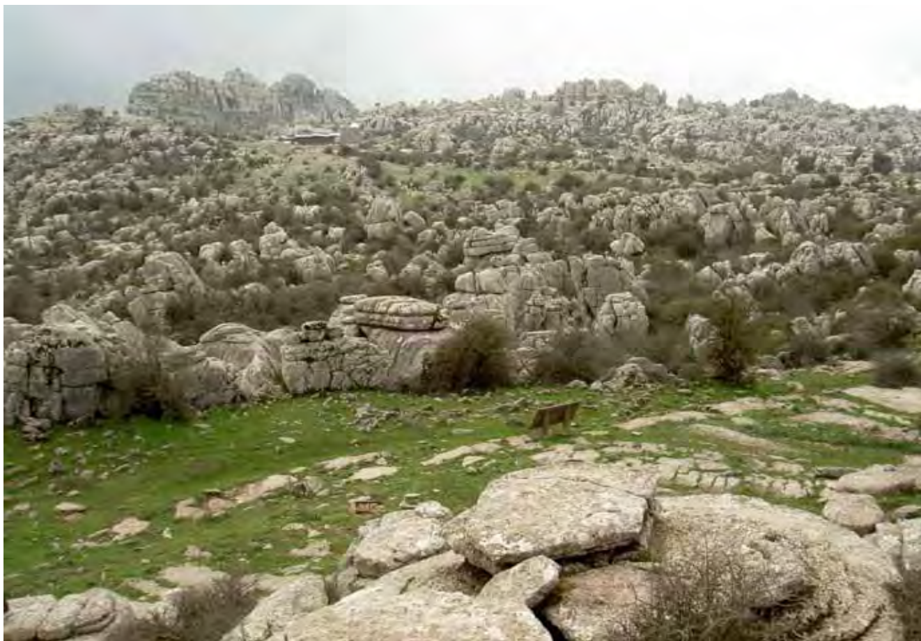
Fig. 9. Mgła nad Torcal, w tle punkt turystyczny • The fog in Torcal, a tourist office in the background