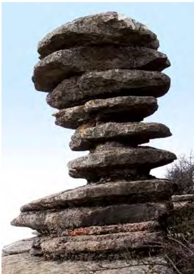
Fig. 12. Pomnik przyrody „Śruba”, fot. M.W. Lorenc • The Natural Monument ‘The Screw’, phot. M.W. Lorenc

Główną atrakcją tej trasy są oczywiście ciekawe formacje skalne, które w wyniku erozji przybierają niezwykle wręcz kształty.