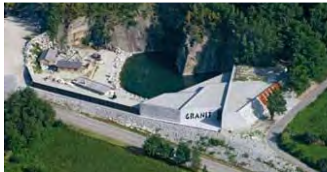
Fig. 5. Muzeum Centrum Granitu w Hanzenberg – przykład doskonałego wykorzystania nieczynnego wyrobiska, fot. www.spiegelau.de • The museum Granite Center in Hanzenberg – an example of a perfect use of an abandoned quarry, phot. www.spiegelau.de

Jak wspomniano na początku, od 2010 roku kamieniołom jest własnością prywatną. Obecnie opiekę nad tym miejscem sprawuje firma Granex Sp. z o.o. ze Strzegomia, najbliższy sąsiad kamieniołomu bazaltu. Rozpoczęły się działania nad powołaniem fundacji, której najważniejszym celem statutowym będzie adaptacja terenu nieczynnego kamieniołomu i nadanie mu funkcji użytkowych. Założenie podstawowe adaptacji kamie-