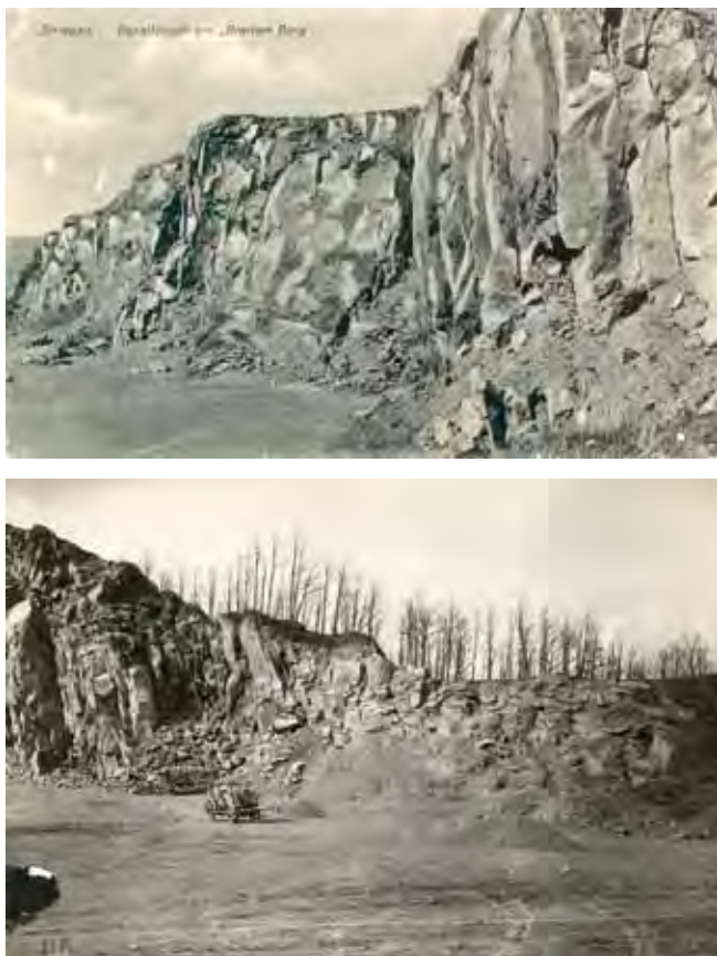
Fig. 2. Kamieniołom bazaltu na historycznych fotografiach • Historic photographs of the basalt quarry

Minerały nieprzezroczyste rozproszone są w obrębie całej skały. Drobne (0,3–0,8 mm) kryształki oliwiny dominują wśród fenokryształów. Nieco mniejsze, równie świeże fenokryształy augitu wykazują wyraźną strukturę strefową (Birkenmajer et al. 2004).