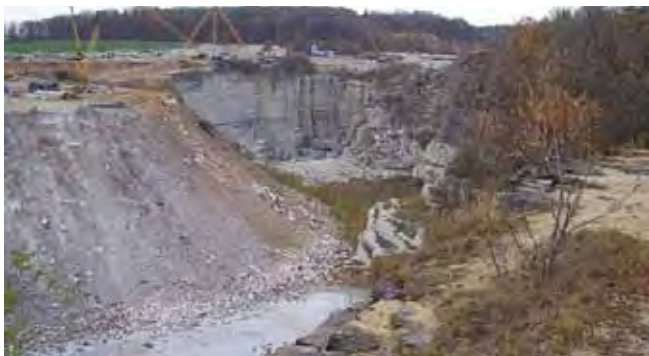
Fig. 4. Kamieniołom Barcz, niegdyś jeden z najgłębszych kamieniołomów granitu i świadectwo przemysłowego krajobrazu górniczego, obecnie zasypywany i dewastowany przez odpady budowlane • The Barcz quarry, in the past one of deepest granite quarries and evidence of the industrial mining landscape, recently is successively filled and devastated by industrial waste

Zagospodarowywanie tego ekosystemu jest jak najbardziej możliwe i celowe, powinno jednak zapewnić stan względnej równowagi ekologicznej systemów przyrodniczych.