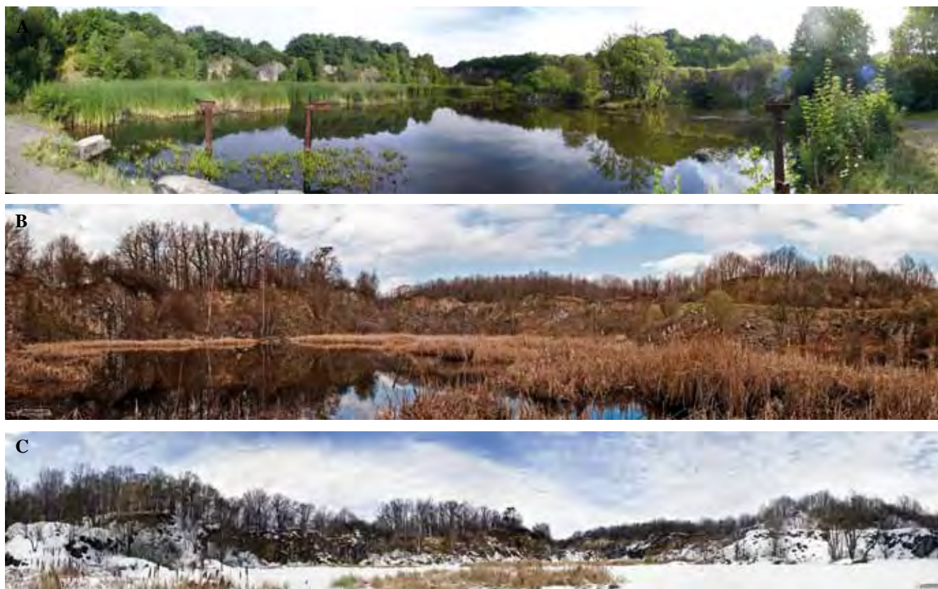
Fig. 3. Stan obecny kamieniołomu bazaltu w Strzegomiu – po rekultywacji wykonanej przez naturę, 3a – fot. K. Skolak, 3b, c – fot. S. Dzieniszewski • Recent state of basalt quarry in Strzegom after natural recultivation, 3a – phot. K. Skolak, 3b, c – phot. S. Dzieniszewski

Często są to tereny gminne, zaś gminy, szukając możliwości zwiększenia budżetu, sprzedają takie tereny. W zależności od tego, jakie cele ma nowy inwestor, obszar ten może zostać przekształcony w składowisko odpadów (Fig. 4) lub wykorzystany zgodnie z jego potencjałem, czego przykładem jest dawny kamieniołom wapienia na Malcie (Skoczyła 2008) czy też doskonale zaprojektowane i wykonane, nowe zagospodarowanie kamieniołomu granitu w Hanzenberg w Niemczech (Fig. 5).