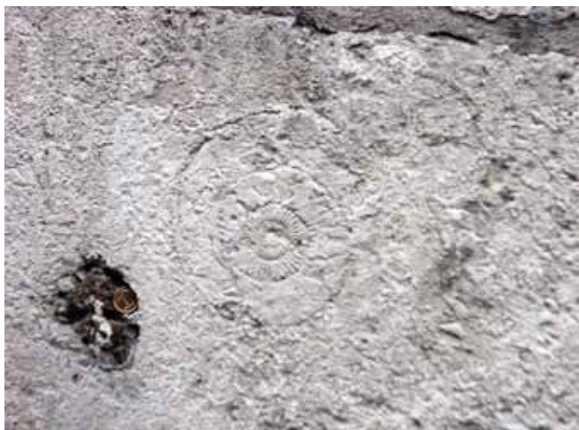
Fig. 9. Ammonite in the Upper Jurassic limestone block in Collegium Maius walls, phot. A. Majer-Durman • Osródka amonita w bloku górnójurajskiego wapienia murów Collegium, fot. A. Majer-Durman