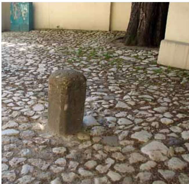
Fig. 6. Fragment of the road pavement made of cobblestones by the St. Idzi Church, • Fragment nawierzchni utworzony z tzw. „kocich łbów” przy kościele św. Idziego