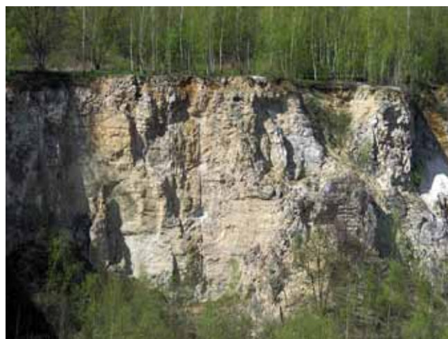
Fig. 4. Upper Jurassic bedded limestones outcrop in the Liban quarry • Odslonięcie wapieni uławiconych górnej jury w kamieniołomie Liban