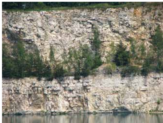
Fig. 3. Bedded limestones outcrop in the Zakrzówek quarry, phot. A. Majer-Durman • Odslonięcie wapieni uławiconych w kamieniołomie Zakrzówek, fot. A. Majer-Durman

Going further west, along Rękawka and Jan Zamoyski Streets, we reach Parkowa Street. The second oldest quarries appears there, the so-called “Twardowski School” (Fig. 2, point 4), in which Upper Jurassic limestones were excavated for the purpose of city construction. The quarry had