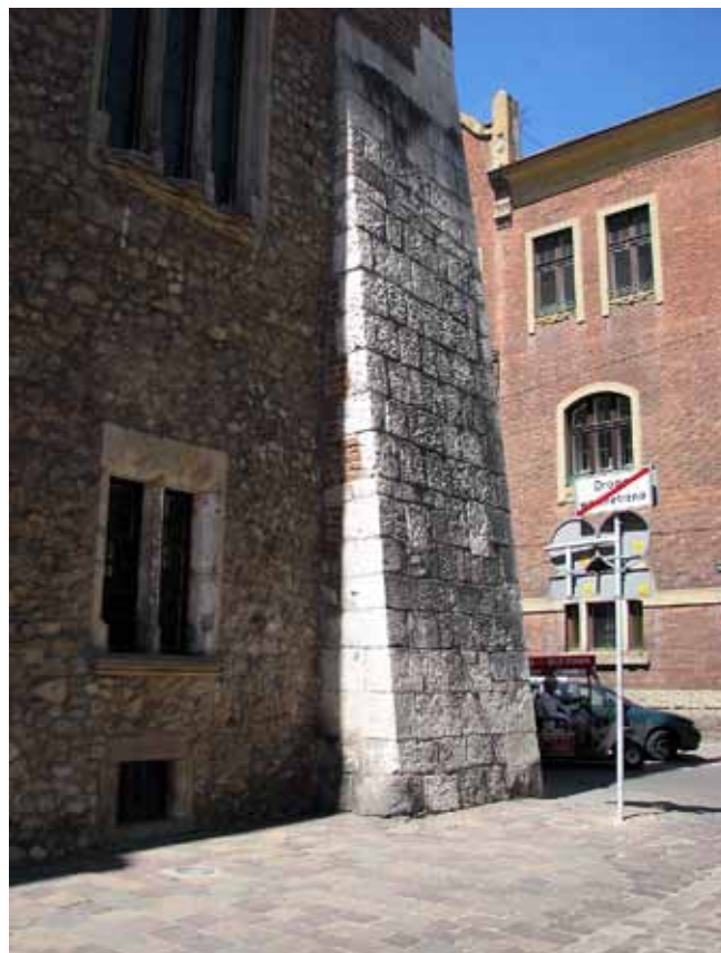
Fig. 8. Collegium Maius building with escarpment made of the Upper Jurassic grand appareil blocks, as well as fragments of the opus incertum wall made of the same material • Budynek Collegium Maius na rogu ulic Jagiellońskiej i św. Anny. Widoczna skarpa z bloków grand appareil z wapienia górnojurajskiego oraz fragment muru opus incertum z tego surowca

Another question was: “Do you think that organization of a geotouristic trail showing the sites of natural occurrence of limestones used in buildings in Cracow would be a successful extension of the touristic offer?”