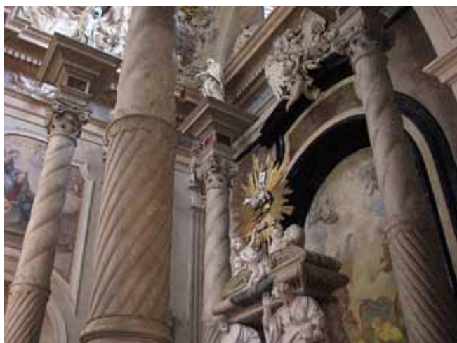
Fig. 11. Columns made of the "blessed Salomea's marble" in the St. Anne Collegiate in Cracow • Kolumny z „marmuru bł. Salomei” w kolegiacie św. Anny w Krakowie

The answers were analyzed considering respondents education and age, the latter divided into three age groups: 18–30, 31–55 and over 56 years old. According to the answers, 58% of respondents are aware of quarry occurrence within the Cracow area, in particular age groups: 44%, 69% and 78%, respectively. In the group 18–30 years old, the knowledge of this subject is poorest.