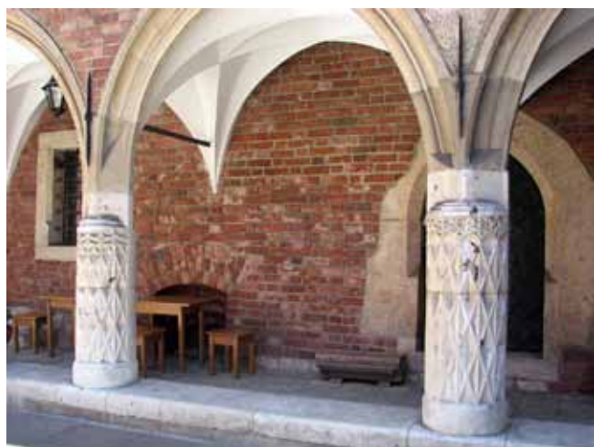
Fig. 10. Columns made of massive limestone with flints in the courtyard of the Collegium Maius • Kolumny wykonane z wapienia skalistego z krzemieniami na dziedzińcu Collegium Maius