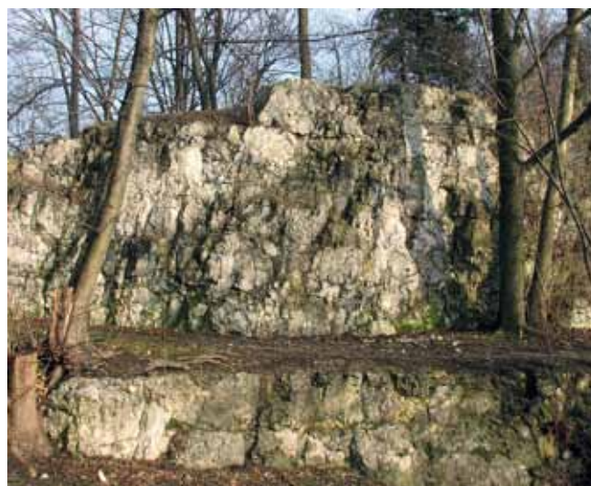
Fig. 5. Upper Jurassic limestones outcrop in the Bednarski Park • Odslonięcie wapieni górnourajskich w Parku im. W. Bednarskiego