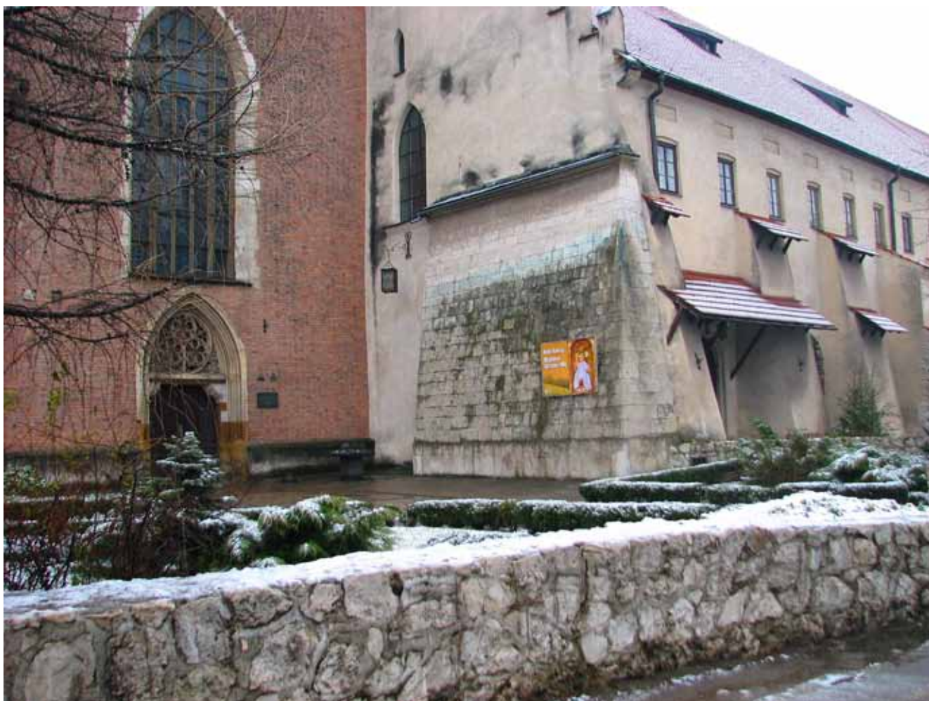
Fig. 7. Jurassic limestone escarpment by the Franciscan Church • Skarpa z wapienia jurajskiego przy kościele oo. Franciszkanów

After recognition of the old, Upper Jurassic limestones quarries located in the former city outskirts, we are now going to the city centre. Leaving the Park and heading to the west, after about 100 meters, we reach Kalwaryjska Street. At the stop “Korona”, we take tram No. 3, 6, 8 or 10 and, after 10 minutes, we approach the Wawel Hill at the exit of Grodzka Street. At the intersection of Grodzka and the St Idzi streets we examine the first site where Jurassic limestones were used in the city architecture (Fig. 2, point 5). Around St. Idzi church there appear fragments of the old road with well-preserved cobblestones. This pavement was made of irregular limestone lumps from several to several dozens of centimeters across. Their oval shapes were an