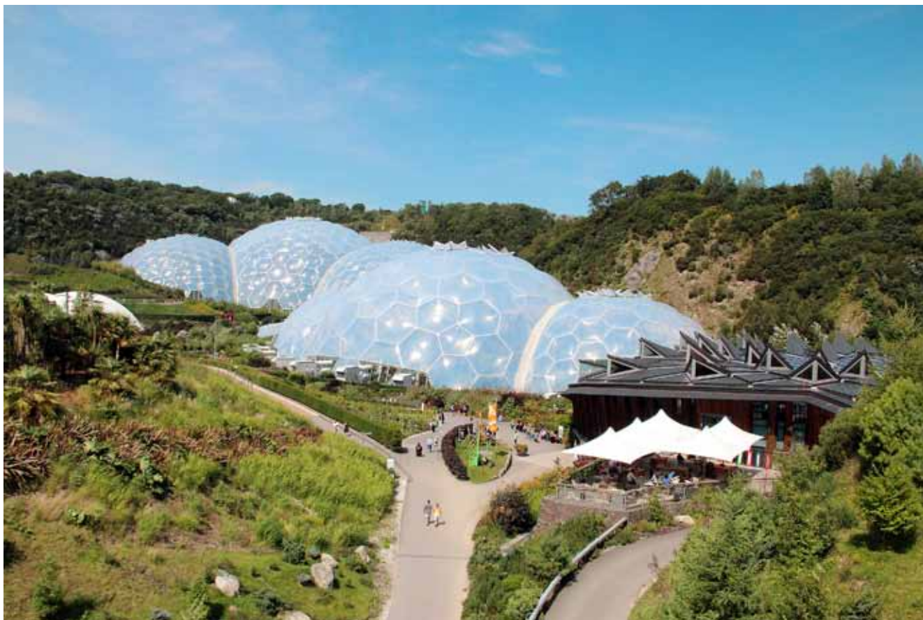
Fig. 6. View of the Eden Project • Widok na Projekt Eden