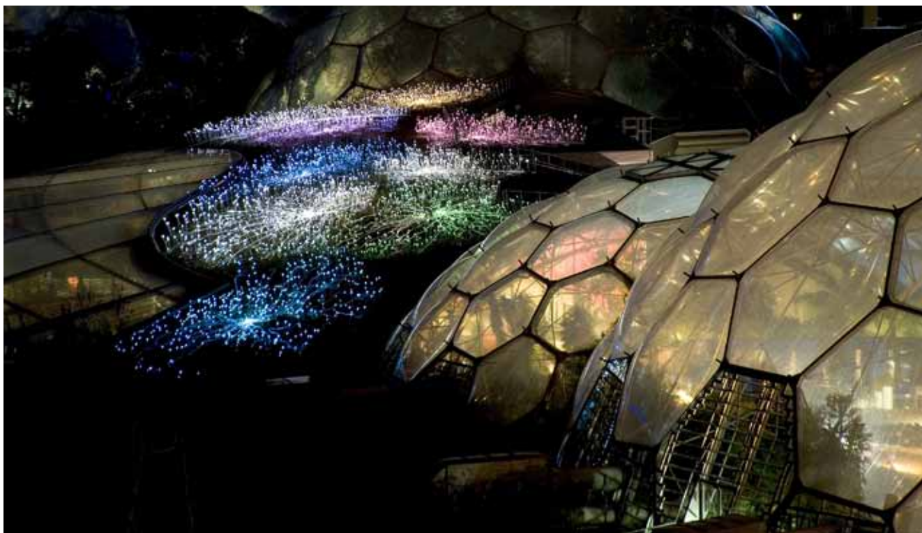
Fig. 15. Illumination of the Eden Project designed by Bruce Munro • Iluminacja Projektu Eden autorstwa Bruce Munro

From here to the bus stop located at the entrance the visitors can take internal communication buses. The routes are marked with corresponding fruit names.