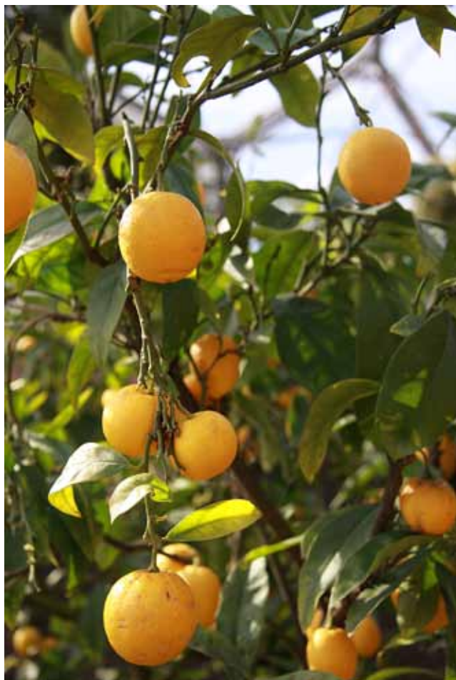
Fig. 12 Mandarin orange tree ( Citrus reticulata ), phot. E. Baczyńska • Drzewko mandarynkowe ( Citrus reticulata ), fot. E. Baczyńska Fig. 13. A huge bee placed in the external biome with information boards explaining the problem of a decreasing number of insects on the Earth and their role in our life, phot. E. Baczyńska • Gigantyczna pszczoła umiejscowiona w biomie zewnętrznym, dodatkowo opatrzona tablicami informującymi o problemie zmniejszania się liczby owadów na ziemi i ich znaczeniu dla życia człowieka, fot. E. Baczyńska

A supply of huge amounts of water and energy necessary to maintain such a huge number of plants in an artificial, man-made environment usually requires enormous expenses. However, the Eden Project is future-oriented as it has been designed in accordance with all the rules of environment protection and recycling. The initiators have taken advantage of opportunities provided by the British climate. If possible, a closed water circulation system is applied and rainwater is used for irrigation.