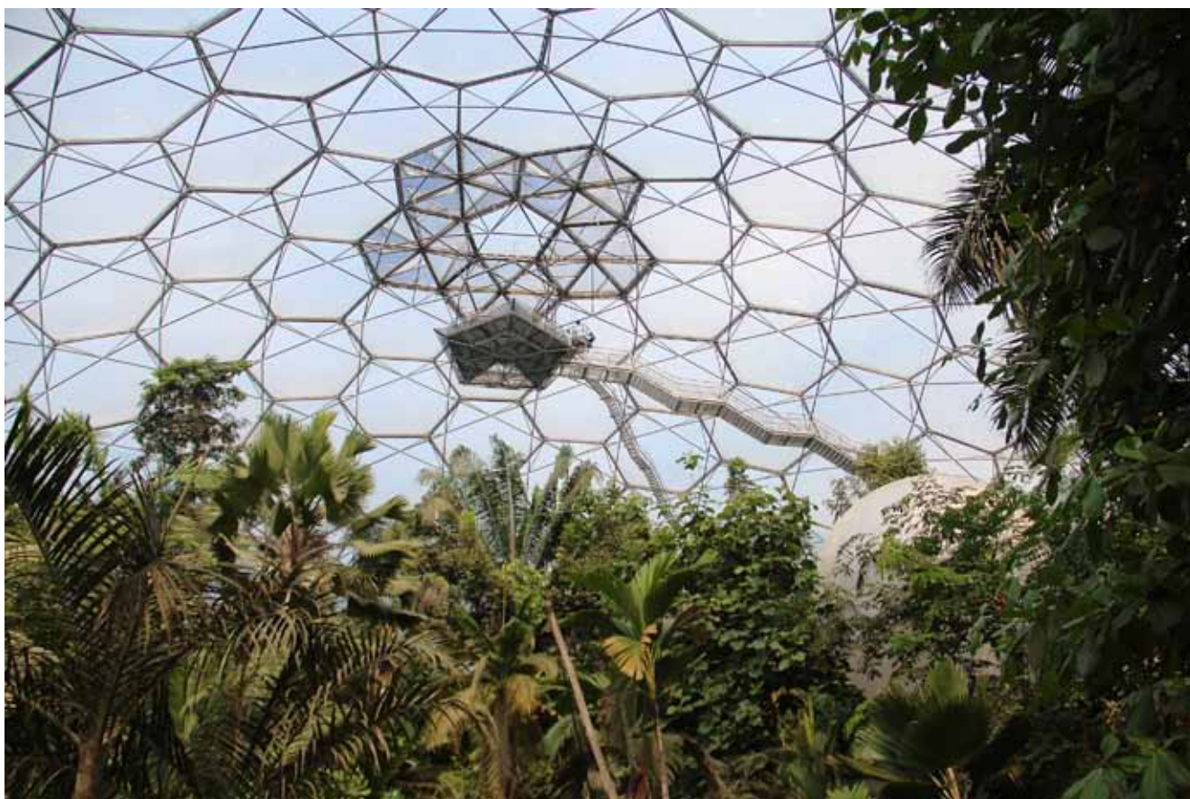
Fig. 11. The Mediterranean biome. General view of the biome and of the lookout platform • Biom śródziemnomorski. Widok ogólny na biom i na platformę widokową