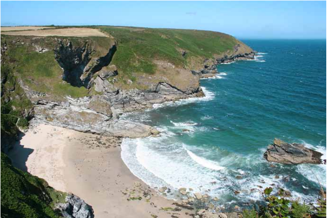
Fig. 1. Fishing Cove – one of many bays on the northern coast, phot. M.W. Lorenc • Fishing Cove – jedna z wielu zatok na północnym wybrzeżu, fot. M.W. Lorenc