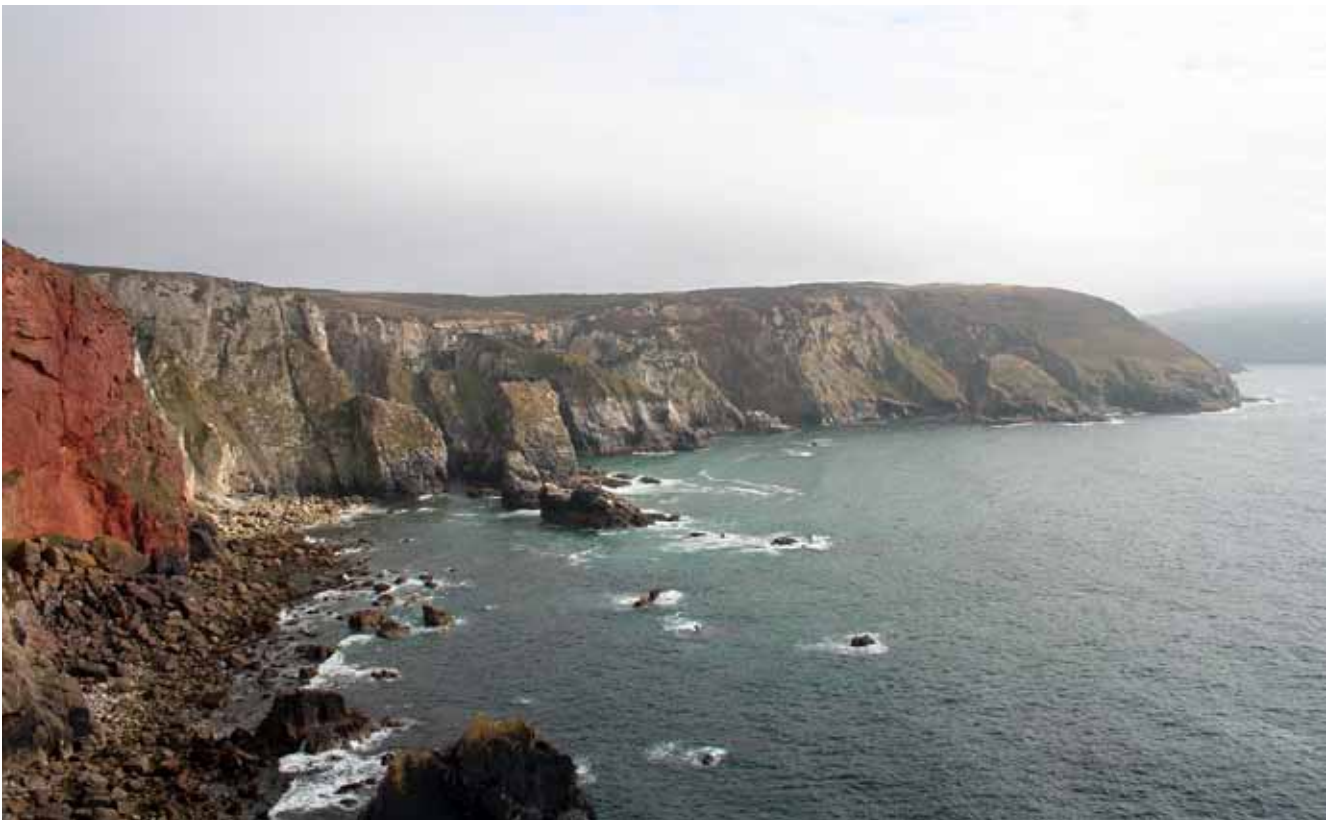
Fig. 2. Cligga Head – one of many cliffs on the northern coast • Cligga Head – jeden z wielu klifów na północnym wybrzeżu