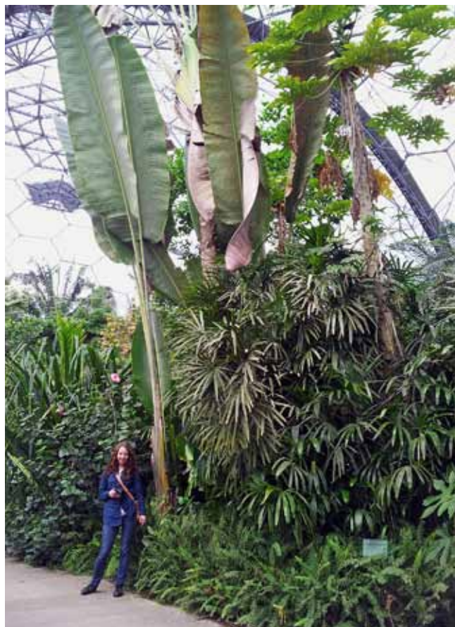
Fig. 8. View of the tropical biome • Widok na biom tropikalny

Plants living in these regions have adjusted to difficult water-soil conditions and generated special survival strategies. Various forms of leaves can be seen here – small green ones with hair as well as thorny or waxy leaves producing protective oils. As in the previous biome, all species are described in detail. Surprises for the youngest visitors are also available: competitions, hidden questions and interactive devices.