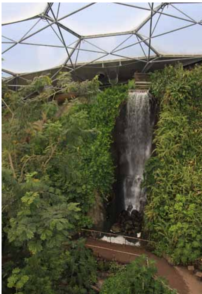
Fig. 7. View of the waterfall from a lookout platform located under the dome of the tropical biome, phot. E. Baczyńska. Widok na wodospad z tarasu widokowego znajdującego się pod dachem kopuły biomu tropikalnego, fot. E. Baczyńska

Despite the size of the plants, each species has its own information board containing the customary and Latin name, a short description and its usage. It is particularly practical and useful in the case of the youngest visitors because in many parts of the biome there are riddles and puzzles related to the world of plants. In this easy way children can learn, for example that the African kola tree ( Cola acuminata ) gives fruit used for the production of the world-famous drink, however, it takes 12 years before the tree starts to produce seeds. Most puzzles are interactive, which improves the contact of visitors with the surrounding nature.