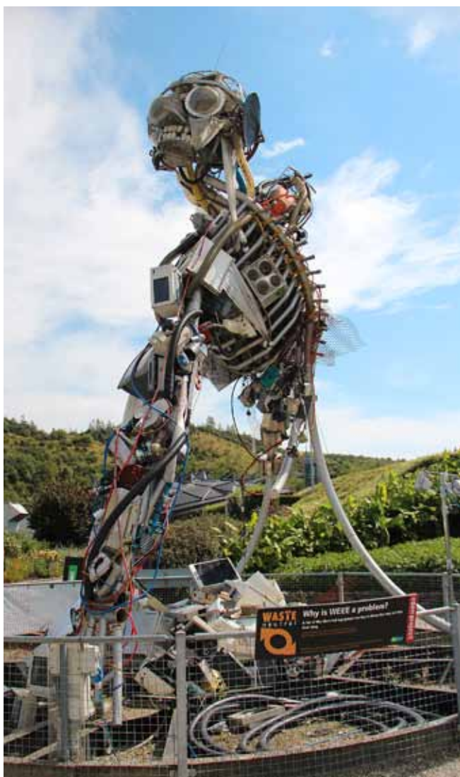
Fig. 14. Sculpture built entirely from wastes with information boards related to the problem of littering the planet • Rzeźba wykonana w całości z odpadów, dodatkowo opatrzona tablicami informującymi o problemie zaśmiecania planety

Due to such solutions, the Eden Project is not only a botanical garden with an impressive collection of plants. It is an enormous educational institution, which presents relations occurring in the nature. The aim of this venture is, above all, to teach the ecological aspects of life on Earth and to reveal the necessity of maintaining biodiversity. In order to emphasize this message, an additional part called “the Core” was built in 2007. Inside this centre visitors can learn out various aspects, such as evolution, ecosystems, plant resources, global warming. One of meaningful means of expression is a plant-machine presenting the dependence of the environment, including our existence, on plants. A few times a year