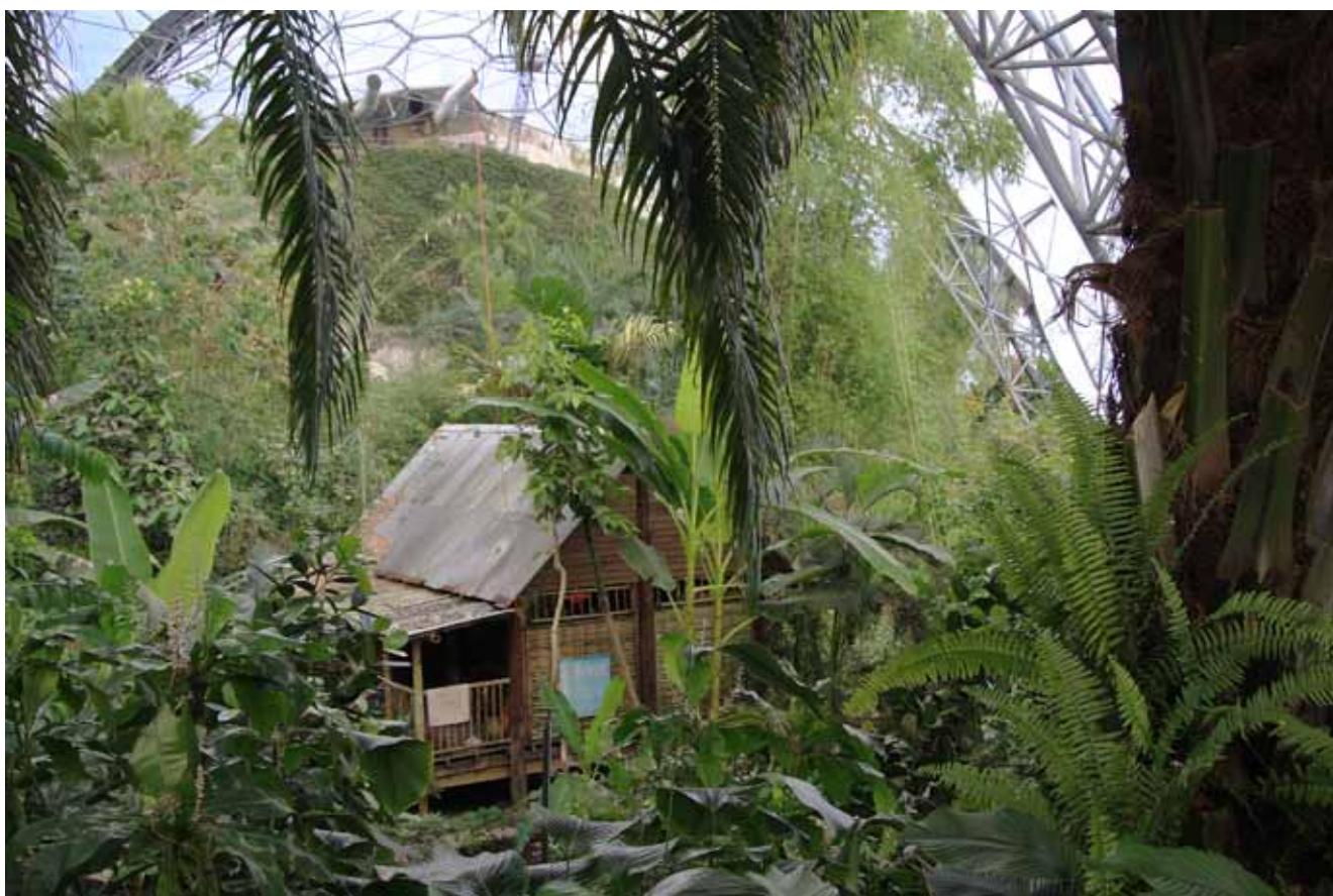
Fig. 9. View of the Malaysian hut surrounded by thick tropical forest • Widok na chatę malezyjską otoczoną przez gęsty las tropikalny