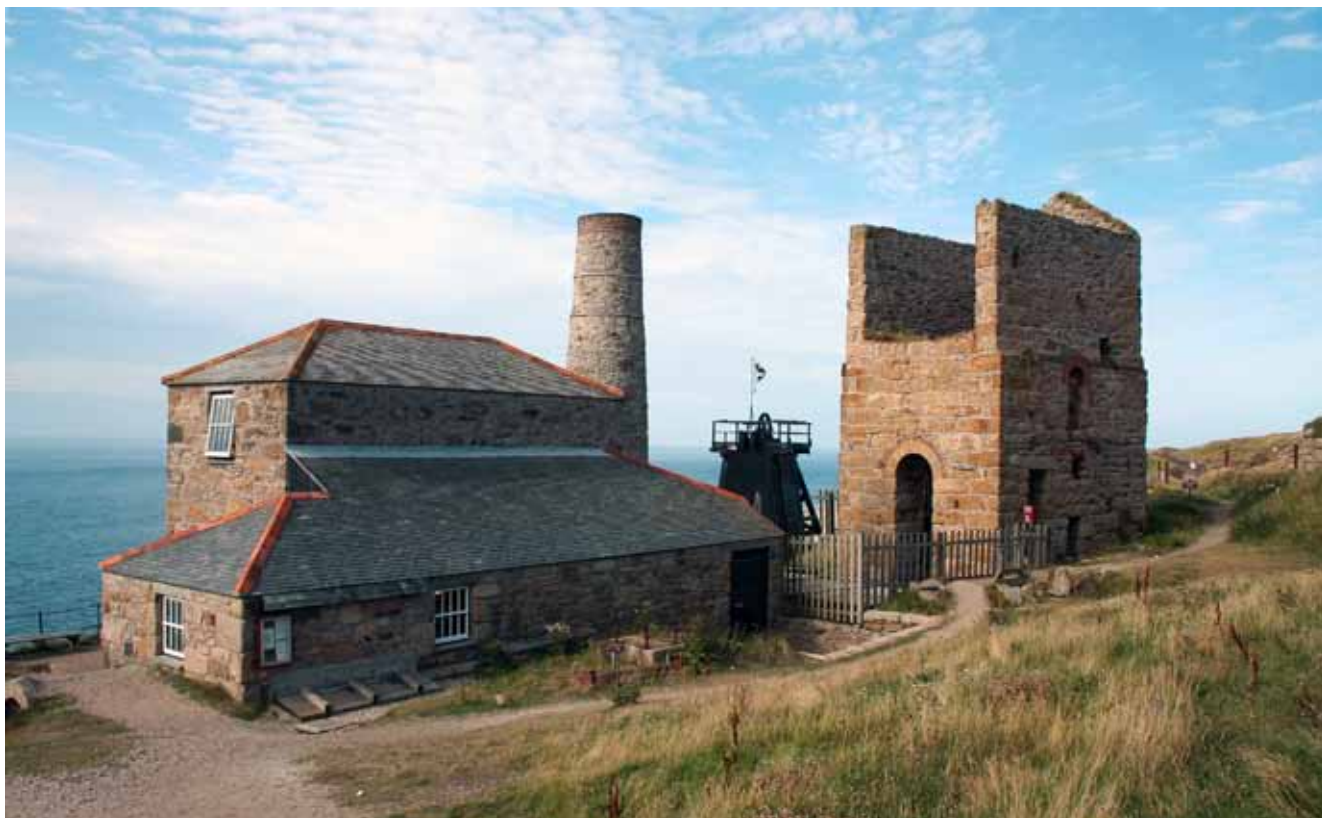
Fig. 3. The Levant Mine – a steam engine from the XIXth century still works in a partly reconstructed engine house • Kopalnia Levant – w częściowo zrekonstruowanej maszynowni do dziś funkcjonuje XIX-wieczny silnik parowy