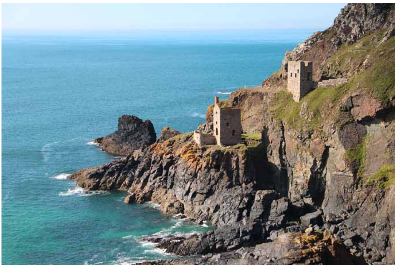
Fig. 4. The Botallack Mine – characteristic steam engine houses from the XIXth century • Kopalnia Botallack – charakterystyczne w swojej formie XIX-wieczne maszynownie parowe