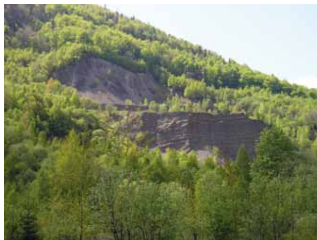
Fig. 4. The quarry walls enclosed by the silver birch zone (the early spring period) • Ściany kamieniołomu otoczone przez pas brzozy brodawkowatej (okres wczesnowiosenny)