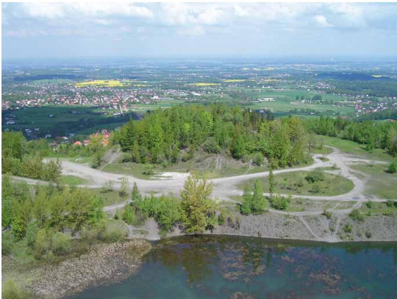
Fig. 2. Panoramic view from the higher level of the quarry toward the Silesian Foothills and the Oświęcim Valley – in the foreground there is a fragment of the pond in the lowest part of the excavation, further on – the reclaimed inner dump of gangue material, phot. J. Badera • Panorama z wyższego poziomu kopalni w kierunku Pogórza Śląskiego i Kotliny Oświęcimskiej – na pierwszym planie widoczny fragment stawu we wgłębnej części wyrobiska, dalej zrehabilitowane zwałowisko wewnętrzne skały płonnej, fot. J. Badera

This was mainly related to the fact that the quarry reached the boundaries of its land property, the quality of raw material deteriorated and the general market situation for mineral resources in the early 1990s was difficult ( http://kozy.vot.pl/okozach/kamieniolom-w-kozach/ ). The quarry still contains considerable resources of raw material of about 23.8 million tons ( http://www.pgi.gov.pl/surowce_mineralne/ ). However, they are not expected to be extracted in the near future due to environmental issues, mainly noise and dust, while the type of mineral is common. From the standpoint of environmental protection and the protection of mineral resources it is a deposit of class 3B.