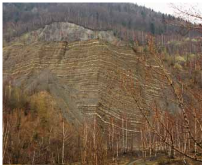
Fig. 3. The quarry in the late spring period surrounded by the community with silver birch ( Betula pendula ) and trembling poplar ( Populus tremula ) • Kamieniołom w okresie późnowiosennym otoczony przez zbiorowisko z udziałem brzozy brodawkowatej ( Betula pendula ) i topoli osiki ( Populus tremula )

The total profile of the exposed rock reaches about 145 m, covering most of the Lgota beds which accumulated at the turn of the Early and Late Cretaceous, namely from the Albian to the Earliest Cenomanian, about 100 million years ago. It is the largest exposure of these layers within the entire Carpathians, and also one of the most spectacular outcrops of the flysch sediments in general. They are situated on top of the shale of the Verovice beds (the areas north of the quarry) and are covered by the thick-layer sandstone of the Godula beds which build higher parts of Chrobacza Łąka (Unrug, 1959).