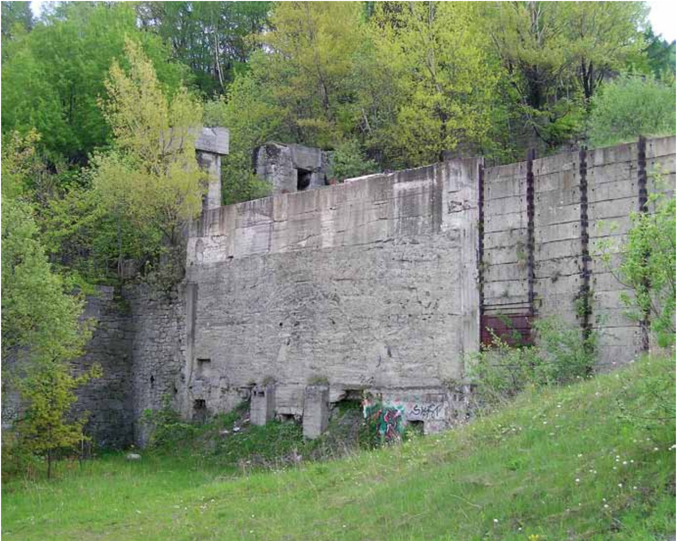
Fig. 10. Spontaneous vegetation succession within remains of the aggregate processing plant, phot. J. Badera • Spontaniczna sukcesja roślinna w obrębie pozostałości zakładu przeróbki kruszywa, fot. J. Badera