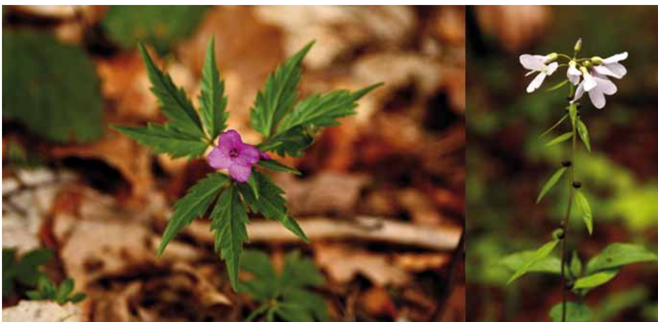
Fig. 9. Dentaria glandulosa (left) and Dentaria bulbifera (right) – elements of the beech forest, phot. F. Sadowski • Żywiec gruczołowy (z lewej) i żywiec cebulkowy (z prawej) – elementy lasu bukowego, fot. F. Sadowski

The so-called “papal” trail crosses the quarry area. Other paths connect this area with other trails (yellow and blue), which lead to the range of the Beskid Mały. During the festival of the Days of Kozy, angling competitions are organized in the pond which fills the lowest part of the excavation. It is even considered to create a commercial fishery here. Above all, however, it is possible to adapt the abandoned mining areas for practicing different varieties of mountain biking, cross-country running, paragliding and, in winter, skiing and tobogganing. This would create opportunities for local residents and tourists for recreation and, at the same time, active contact with nature almost all year round. It seems that, while complying with relevant requirements and coordination of activities, the sports and recreation aspect is not in contradiction with scientific and educational aspect. As a result, the principle of sustainable development is preserved. This approach, although involving only the plantation of greenery in the quarry, was confirmed as one of the many priority projects in the Program of Environmental Protection of the Gmina of Kozy (Blarowski et al. , 2003).