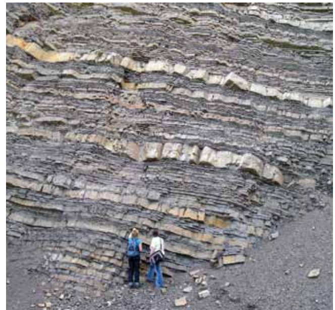
Fig. 6. The Lgota beds – the classic Cretaceous flysch • Warstwy lgockie – klasyczny flisz z okresu kredowego

Another type of habitat is the body of water, which is at the lowest level of the quarry, along with the watercourses flowing into it. The species communities which are formed there are associated with waterlogged habitats.