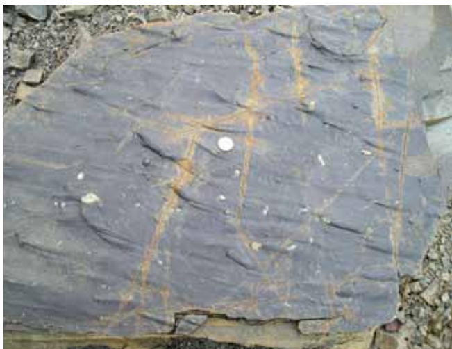
Fig. 8. Flute marks, biogenic nodules and fractures with carbonate mineralization on the subface of sandstone bed, phot. J. Badera • Jamki wirowe, guzy biogeniczne oraz spękania wypełnione „strzałką” węglanową na spągu warstwy piaskowca, fot. J. Badera

In the zones where water drips from the rock the community with shrubby willows, such as Salix cinerea , S. caprea and S. purpurea , is being formed. The banks of small streams are overgrown with Juncus conglomeratus , J. effusus and, at places, by Alisma plantago-aquatica and Petasites albus . In addition, there are also single specimens of Orchis mascula .