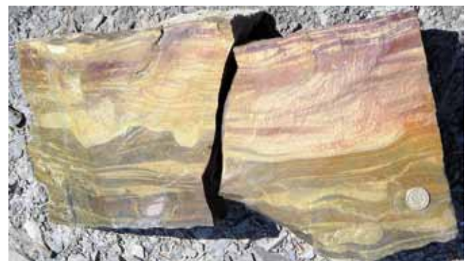
Fig. 7. The fragment of sandstone bed with the cross lamination disturbed by load structures – unit C of the Bouma sequence • Fragment warstwy piaskowca z laminacją przekątną zaburzoną przez struktury obciążeniowe – część C sekwencji Boumy