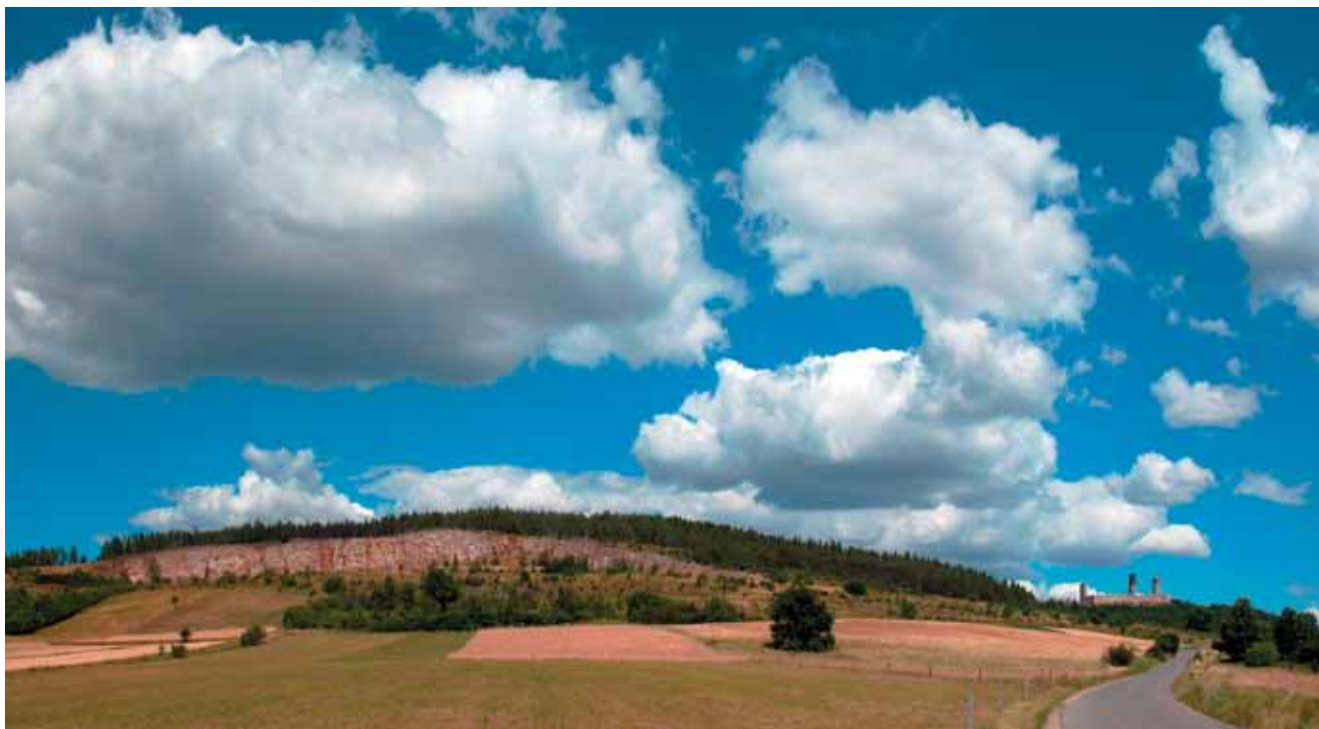
Fig. 4. Góra Rzepka – widok na nieczynny kamieniołom w okolicy Chęciny. Unikatowe wartości naukowe, dydaktyczne i krajobrazowe. Od roku 1981 rezerwat. Wzgórze zbudowane ze skał środkowo- i górnodewońskich dolomitów oraz wapieni. W szczytowej części wzniesienia występują pozostałości dawnego górnictwa kruczcowego rud ołowiu. Z prawej strony widoczne ruiny zamku w Chęcinach • Rzepka Hill – view on the abandoned quarry in Chęciny surroundings. Unique scientific, teaching and landscape values. Since 1981 reserve. Hill is built by middle and upper Devon dolomites and limestone. In the top hill remains of former mining (ores of lead). On the right – ruins of the castle in Chęciny

Brak odpowiedniego nadzoru ze strony służb ochrony przyrody i krajobrazu – tzw. ochrona bierna – może doprowadzić do zarastania kamieniołomów w wyniku naturalnych procesów sukcesji roślinności, przez co obiekty takie stają się niewidoczne w krajobrazie, np. Góra Zelejowa (Pietrzyk-Sokulska 2001, 2004; Stawicki 2003). Drugi przypadek dotyczy obiektów geologiczno-górnictwowych o unikatowych formach skalnych chronionych w postaci rezerwatów przyrody nieożywionej (dawniej rezerwatów geologicznych). W celu ochrony zasobów georóżnorodności możliwe jest tworzenie geostanowisk ( http://www.geosilesia.pl/295,geostanowiska_województwa_slaskiego ).