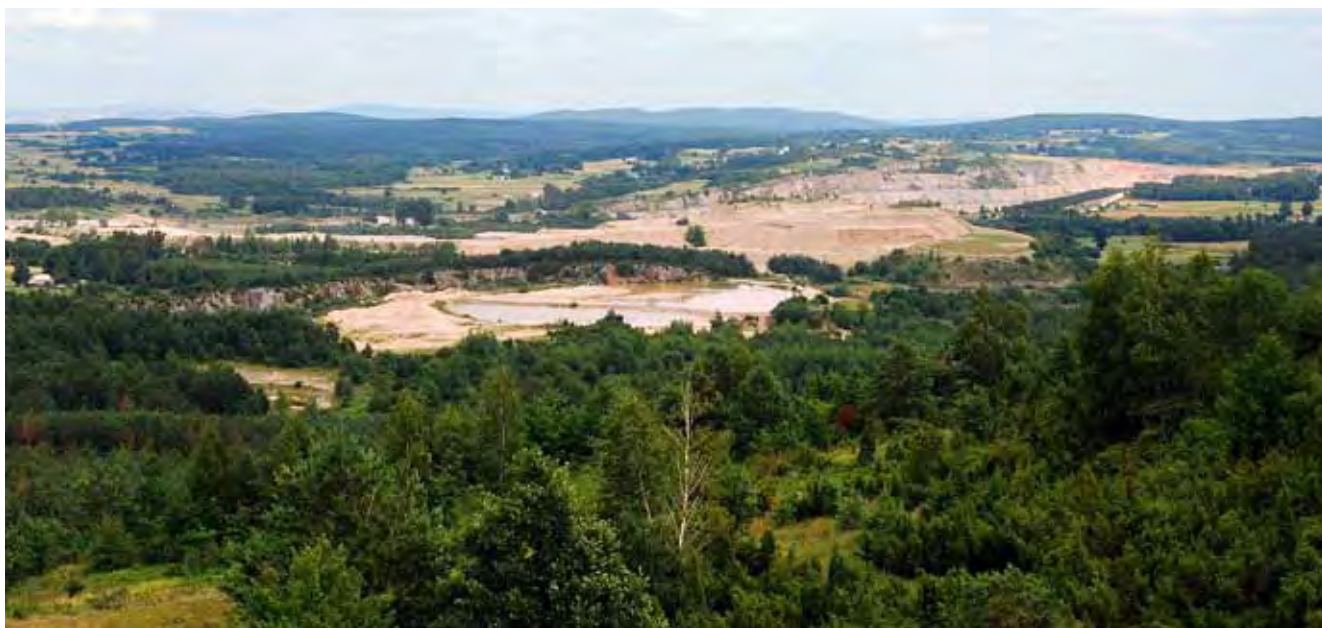
Fig. 7. Góra Ołowianka i Ostrówka – widok z Góry Miedzianka na nieczynny kamieniołom Ołowianka i kopalnię rud miedzi (Górki Sowie, kopalnia Zofia) oraz kamieniołom Ostrówka, za nią Góra Skałka w Gałęzicach • Ołowianka i Ostrówka hills – view from the Miedzianka hill on abandoned query Ołowianka and copper ores mine (Górki Sowie, mine Zofia) and Ostrówka query. On the background Skałka Hill in Gałęzice

Wszystkie te cele i rozwiązania reprezentuje region chęcińsko-kielecki. Pod względem dziedzictwa geologicznego region ten należy do najbogatszych w Polsce. Wielowiekowa działalność eksploatacyjna surowców skalnych wykształciła tu unikatowy krajobraz. Przedstawione powyżej przypadki dokumentują występujący w regionie potencjał mogący posłużyć rozwojowi turystyki i dydaktyki geologicznej oraz szeroko rozumianego krajoznawstwa. Wiele z miejsc czeka także na zagospodarowanie w kierunkach bardziej awangardowych i komercyjnych (przestrzenie kreatywne), w celu rozwoju szerszego spektrum funkcji np. wypromowania na ich terenie funkcji rekreacyjnej, sportowej, rozrywkowej, wypoczynkowej (np. tereny zieleni urządzonej – parki, ogrody botaniczne, amfiteatry itp.), a nawet budownictwa jednorodzinne. Pod tym względem analizowany obszar ma szansę stać się modelowym w Polsce. Jego promocji służyć będzie na pewno projektowany geopark Dolina Kamiennej, którego rola może okazać się istotnym impulsem w aktywizacji gospodarczej całego regionu. □