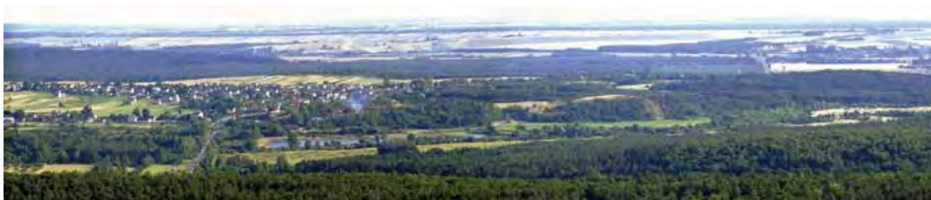
Fig. 3. Dolina Czarnej Nidy z zatopioną piaskownią oraz zwałowiskiem nieczynnego kamieniołomu w Tokarni • The Black Nida River valley with sunk sandpit and debris of the abounded quarry in Tokarnia

Georóżnorodność jest wartościowa z punktu widzenia różnorodności geologicznej, geoekologicznej, ekologicznej, dziedzictwa naturalnego, a nawet z punktu widzenia wartości naukowych, edukacyjnych, społecznych, kulturowych, turystycznych itd. Z tego względu georóżnorodność (jako krajobrazowa całość) powinna podlegać geoochronie w postaci geostanowiska lub geoparku dla obecnych i przyszłych pokoleń (Alexandrowicz 2006; Cañadas, Flaño 2007; Kostrzewski 1998; Kozłowski 1997; Rago 2008; Wróblewski 1999, 2000a,b; Zouros 2008; Zwoliński 2004, 2010). W tym kontekście za walory geoturystyczne należy uznać zespół elementów środowiska geograficznego powiązanych z budową geologiczną danego obszaru, które wspólnie lub każde z osobna mogą stać się przedmiotem zainteresowań turystów i mogą stanowić cel ruchu turystycznego.