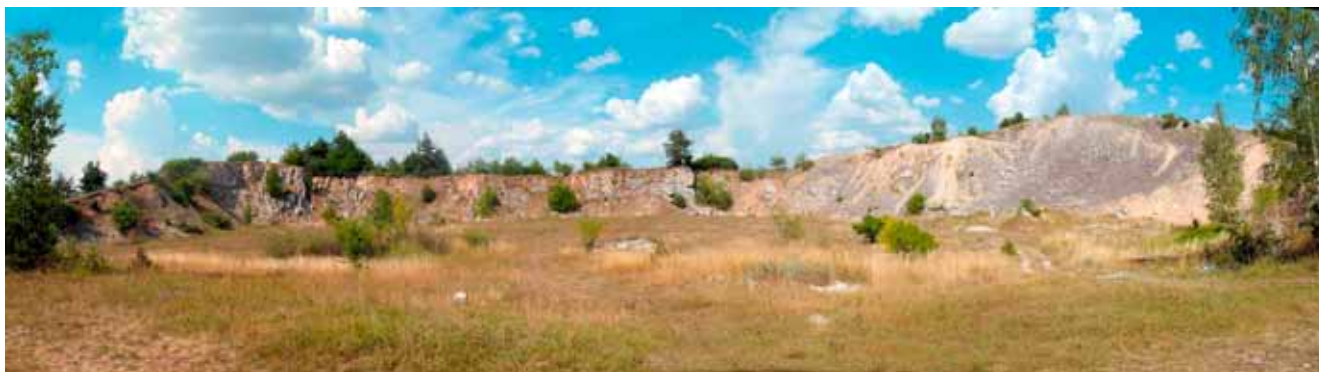
Fig. 5. Leśna Góra – Bardzo interesujący nieczynny kamieniołom na obszarze Leśnej Góry koło Podzamcza. Wzgórze zbudowane z wapieni górnourajskich (kimerydy), czasem zawierających krzemienie • Very interesting abandoned quarry in Leśna Góra near Podzamcze. Hill is built by upper Jurassic limestone with flints