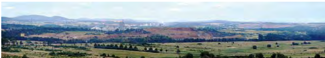
Fig. 2. Widok na największe kamieniołomy w okolicy Chęcińsko-Kieleckiego Parku Krajobrazowego; pierwszy plan Jaźwica, drugi plan z lewej – Trzuskawica, z prawej – Kowala, w dali Kielce • View on the biggest quarries near Chęciny-Kielce Landscape Park; Jaźwica – the foreground, the background from left Trzuskawica, from right Kowala; on the horizon – Kielce