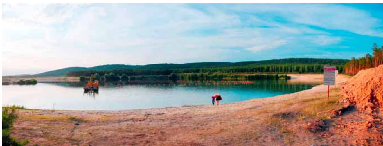
Fig. 6. Mosty – interesująca lokalizacja piaskowni w miejscowości Mosty, na tle wzgórz „Grzywy Korzeczkowskie”. Eksploatacja piasku czwartorzędowego spod wody, w okresie letnich upałów nielegalne kąpielisko • Mosty village – interesting location of sandpit in Mosty village, on the background “Grzywy Korzeczkowskie” hills. Underwater exploitation of the Quaternary sand. In the summer illegal bathing beach

Unikatowe walory, głównie w zakresie przyrody nieożywionej, zdecydowały o ustanowieniu tu aż ośmiu rezerwatów przyrody nieożywionej, w których obowiązuje ochrona częściowa. Są to rezerwaty: „Karczówka”, „Góra Zelejowa”, „Góra Miedzianka”, „Jaskinia Raj”, „Miechowy”, „Biesak-Białogon”, „Góra Rzepka”, „Moczydło”, „Chelosiowa Jama”, „Góra Żakowa”.