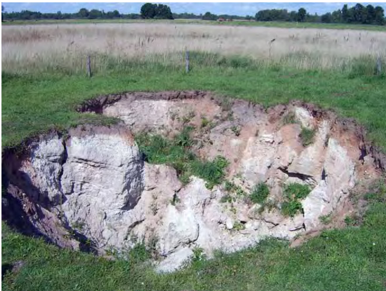
Fig. 7. Zapadlisko krasu gipsowego, tzw. Dół Geologów w okolicach Birżai, fot. M. Labus • Gypsum karst sinkhole near Biržai, named Geologist's Hole, phot. M. Labus

Na Mierzei Kurońskiej występują najwyższe wydmy w całej północnej Europie (najwyższa wydma – Wydma Planistów o wysokości 68 m n.p.m. – znajduje się po rosyjskiej stronie mierzei).