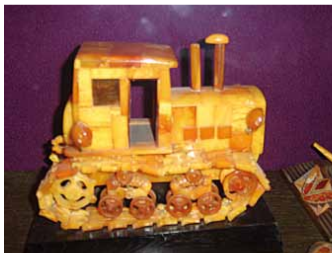
Fig. 6. Jeden z wyrobów bursztynowych – eksponat w Muzeum Bursztynu w Połdze • One of the hadicraft exhibits in Amber Museum in Palanga