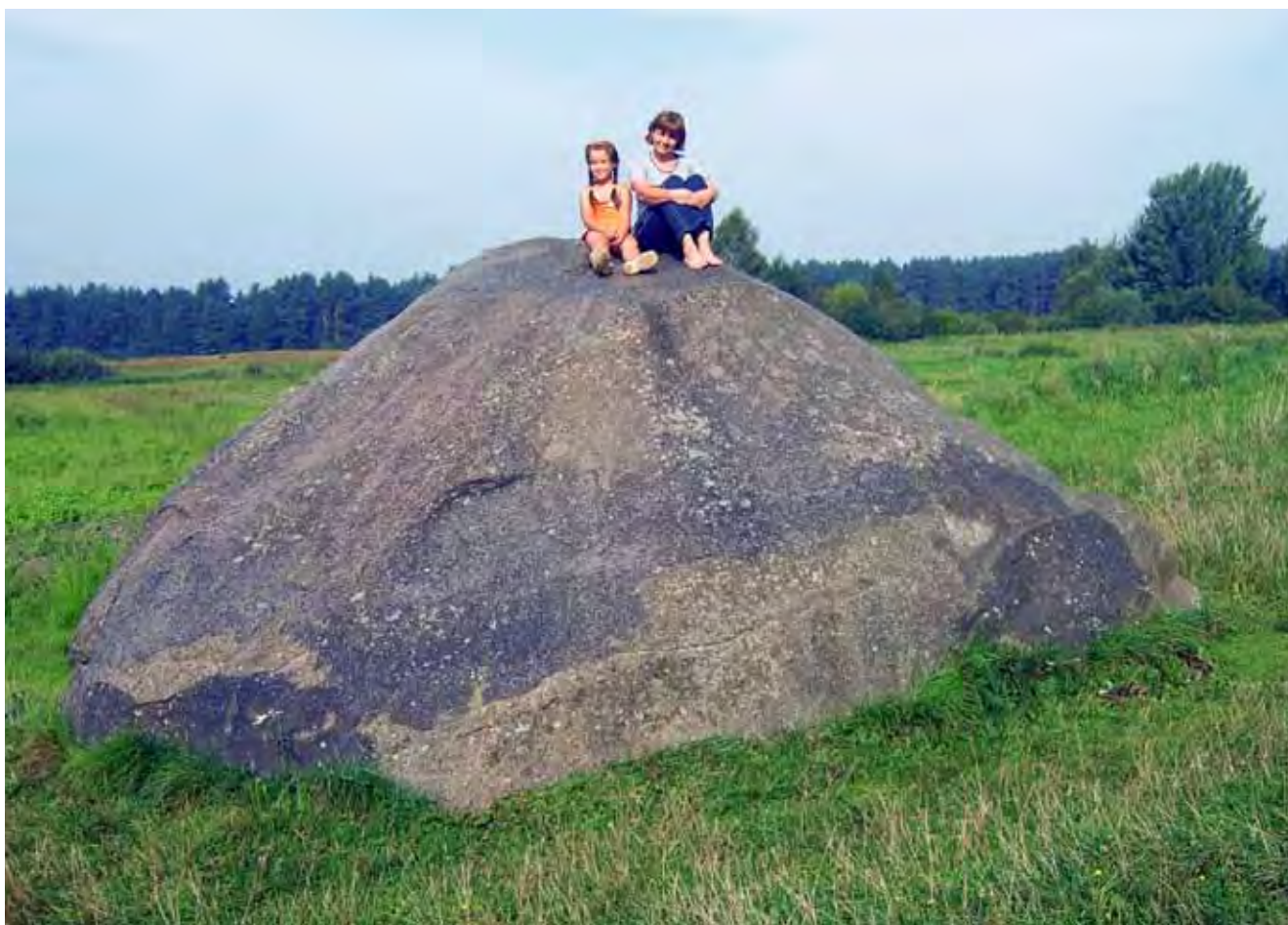
Fig. 3. Diabelski Kamień w wiosce Svendubre (Dzūkijski Park Narodowy), fot. M. Labus • Devil's Stone in Svendubre village (Dzūkija National Park), phot. M. Labus