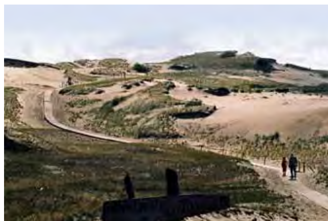
Fig. 5. Piaszczyste wydmy Mierzei Kurońskiej, między Juodkrantė a Pervalką • Sandy dunes of Curonian Spit, spreading from Juodkrantė to Pervalka

W granicach Litwy znajduje się większa część Mierzei Kurońskiej, wąskiego pasa łąd, oddzielającego Zalew Kuroński od otwartego morza (Fig. 4). Południowo-zachodnia część Mierzei i Zalewu Kurońskiego należy do Rosji (obwód kaliningradzki). Szerokość tego pasa łąd waha się od 400 m do 3800 m; całkowita długość wynosi 97 km.