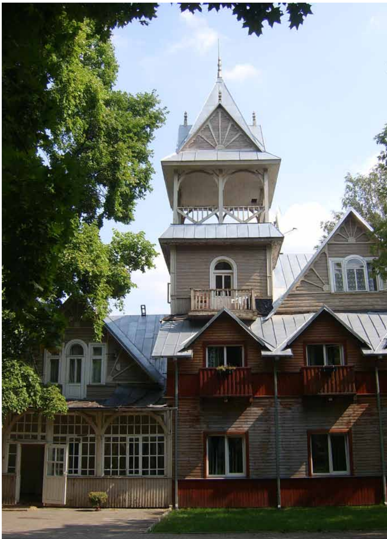
Fig. 8. Zabudowa uzdrowiskowa w Druskiennikach • Spa buildings in Druskiennikai