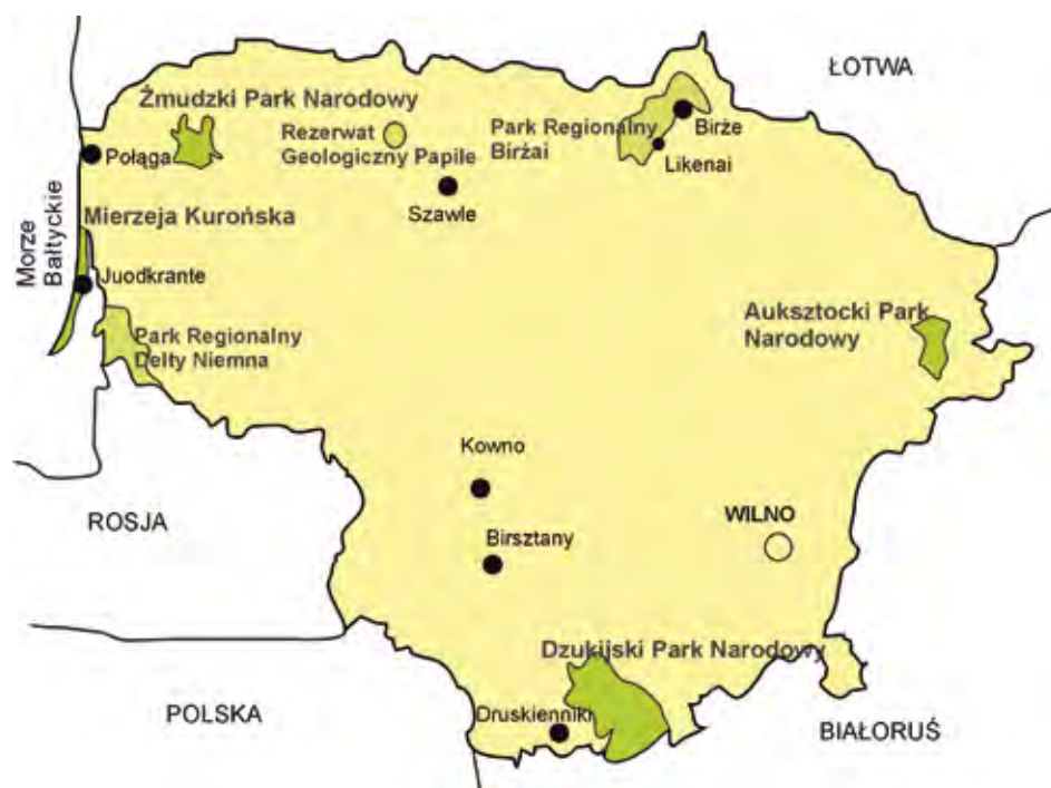
Fig. 4. Lokalizacja ważniejszych miejscowości i obszarów wymienionych w tekście • Situation of the most important places and areas mentioned in the text