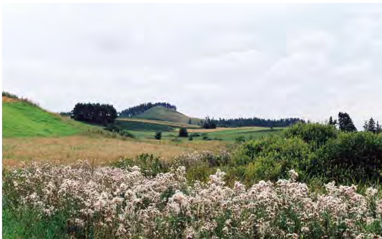
Fig. 2. Charakterystyczne dla krajobrazu Pojezierza Litewskiego pagórki morenowe • Characteristic Lithuanian Lakeland landscape of hilly morainic uplands

Osady czwartorzędowe można podzielić na osady plejstoceńskie, czyli osady zlodowaceń i rozdzielających je interglacjałów oraz osady holoceniowe, czyli współczesne. Do osadów plejstocenu należą przede wszystkim gliny zwałowe i piaski lodowcowe, głązy narzutowe, piaski i żwiry wodnolodowcowe, piaski, mułki i ily zastoiskowe, osady jeziorne i bagienne okresów interglacialnych. W czasie plejstocenu obszar Litwy wielokrotnie znajdował się pod pokrywą lądolodów skandynawskich (ilość tych zlodowaceń określana jest na 7–8). Tylko dwa ostatnie zlodowacenia: Medininkai (odpowiednik zlodowacenia Warty, środkowopolskiego) i Nemunas (Niemna – odpowiadające polskiemu zlodowaceniu Wisły, bałtyckiemu) pozostawiły ślady na powierzchni terenu (Krzywicki 2005).