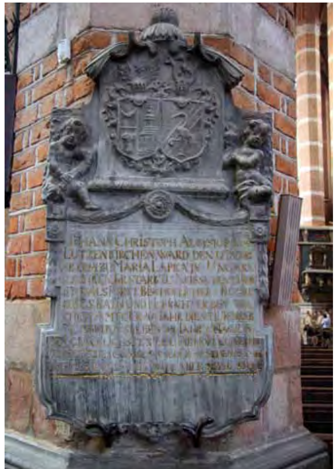
Fig. 6. Epitafium w katedrze w Nysie wykonane z marmuru sławniowickiego • Epitaph made of the Plawniowice marble in the Nysa Cathedral