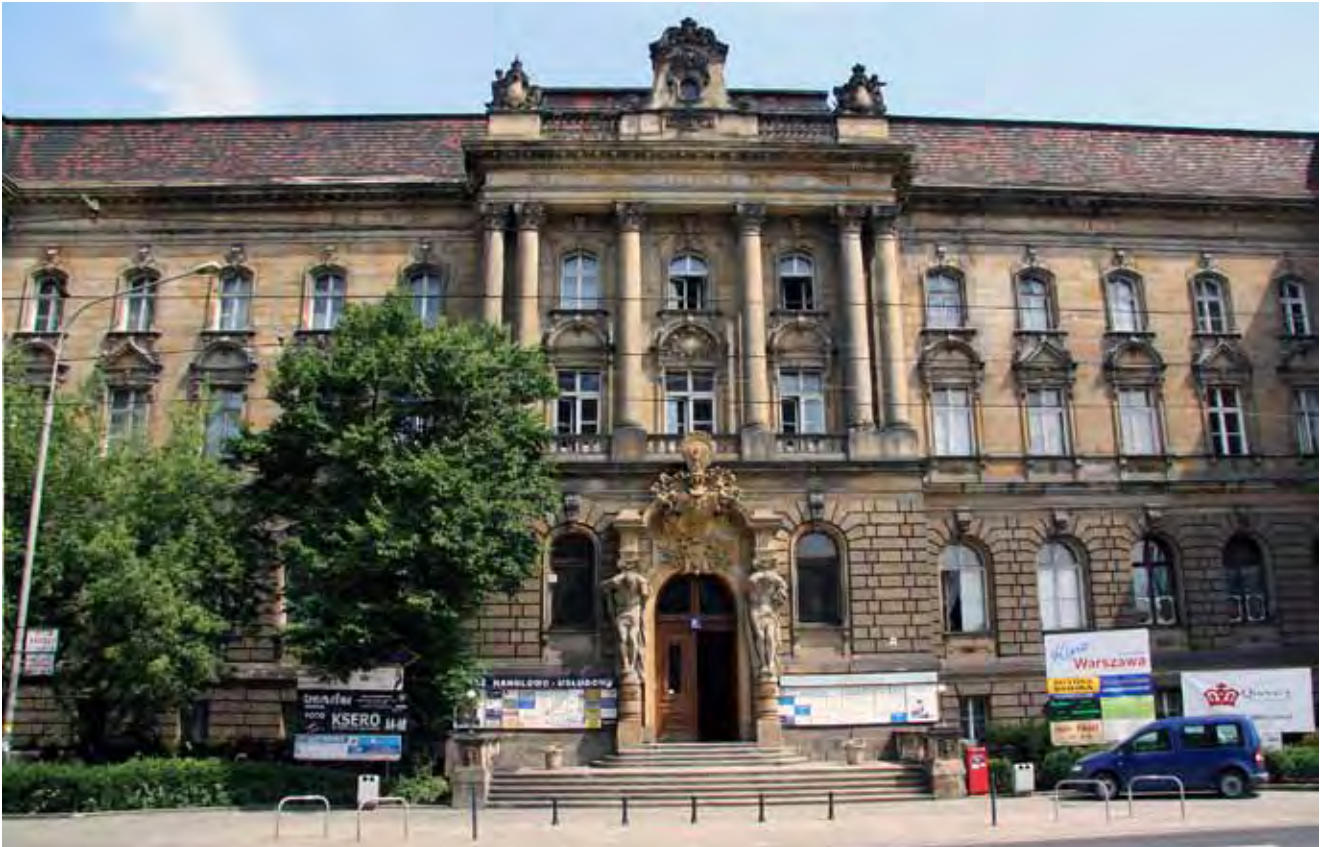
Fig. 4. Elewacja budynku NOT, Wrocław, ul. Piłsudskiego 74. Piaskowiec na budowę w latach 1894–1896 dostarczała firma Zeidler & Wimmel i określiła go jako „piaskowiec śląski” • Facade of the NOT building in Wrocław, Piłsudskiego Str. 74 made of so-called “Silesian sandstone” delivered by Zeidler & Wimmel firm in 1894–1896