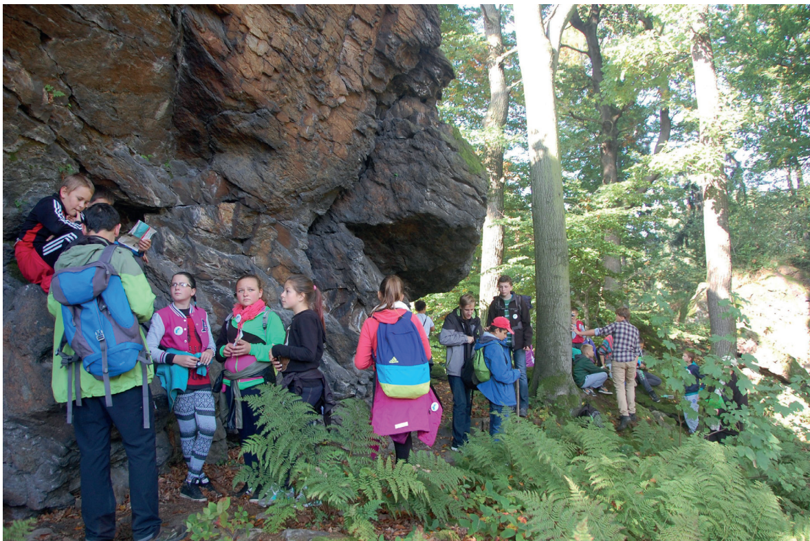
Fig. 3. Edukacja młodzieży z wykorzystaniem materiałów drukowanych. Grochowa, Geopark Przedgórze Sudeckie • Youth education with the usage of printed materials. Grochowa. Sudetic Foreland Geopark