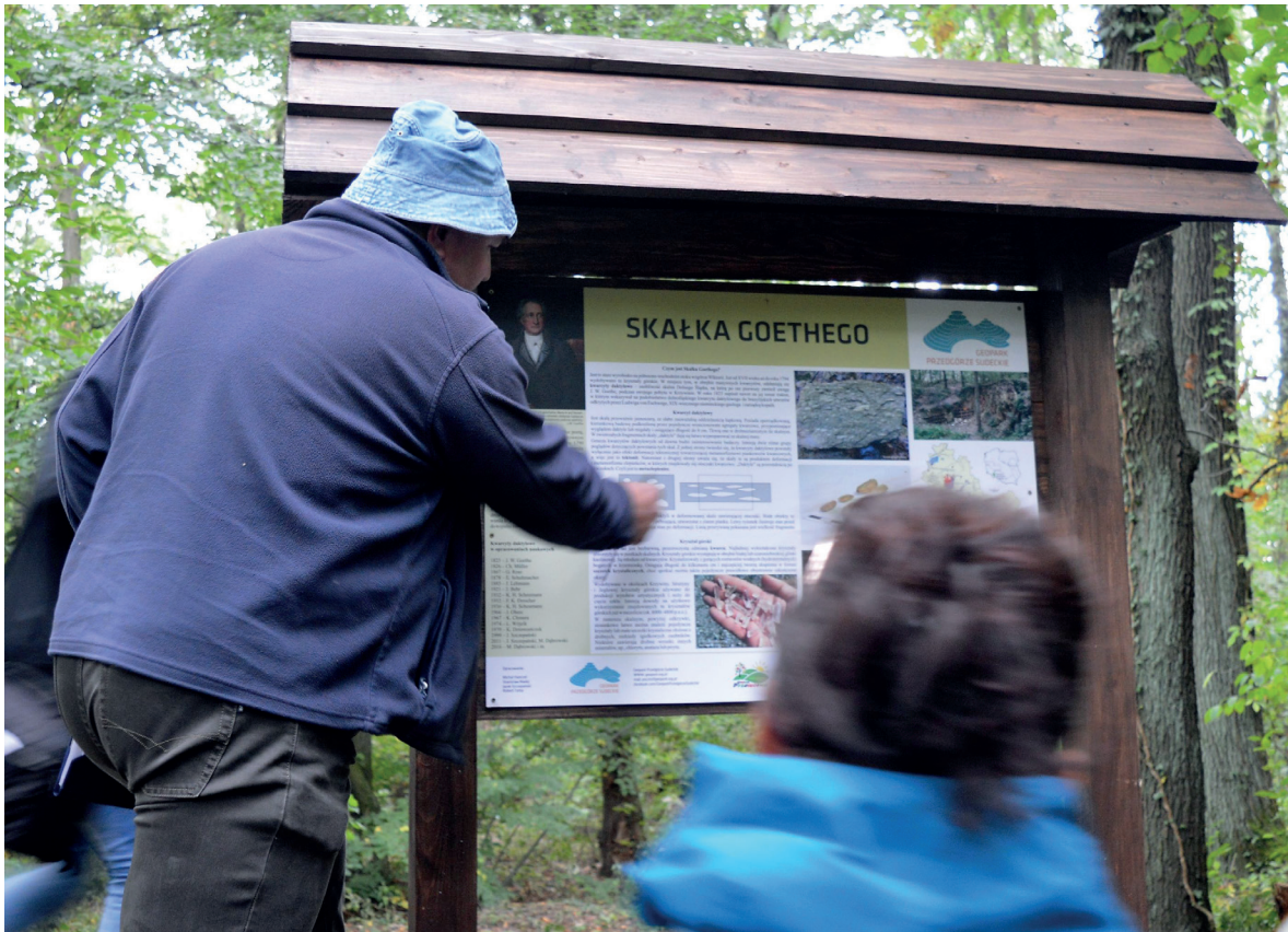
Fig. 2. Tablica informacyjna przed geostanowiskiem „Skalka Goethego” Geopark Przedgórze Sudeckie • Information board in front of the “Goethe Rock” Sudetic Foreland Geopark