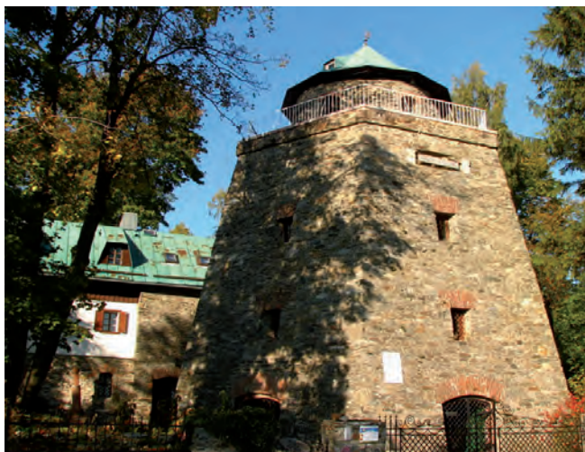
Fig. 11. „Gracious Stone” lime kiln in Kletno • Wapiennik „Łaskawy Kamień” w Kletnie

It performed its industrial function until 1924, and then to 1945 it housed a primitive youth hostel. In the 1950s there were attempts to restore it to its former industrial function, which failed and the object fell into disrepair. In 1978, the historic building was adapted by the Rybczyński family who, following the renovation of the buildings, gave it an exhibition – residential function. Since 1980 cultural events, exhibitions and concerts are held in the lime kiln (Rybczyński, 1998).