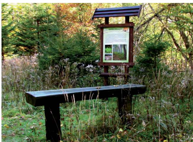
Fig. 4. A stop on the karst path in Kletno • Przystanek ścieżki krasowej w Kletnie

The Marianna Spring provides water spontaneously flowing from a bore-hole of a depth of 120 m (Fig. 5).