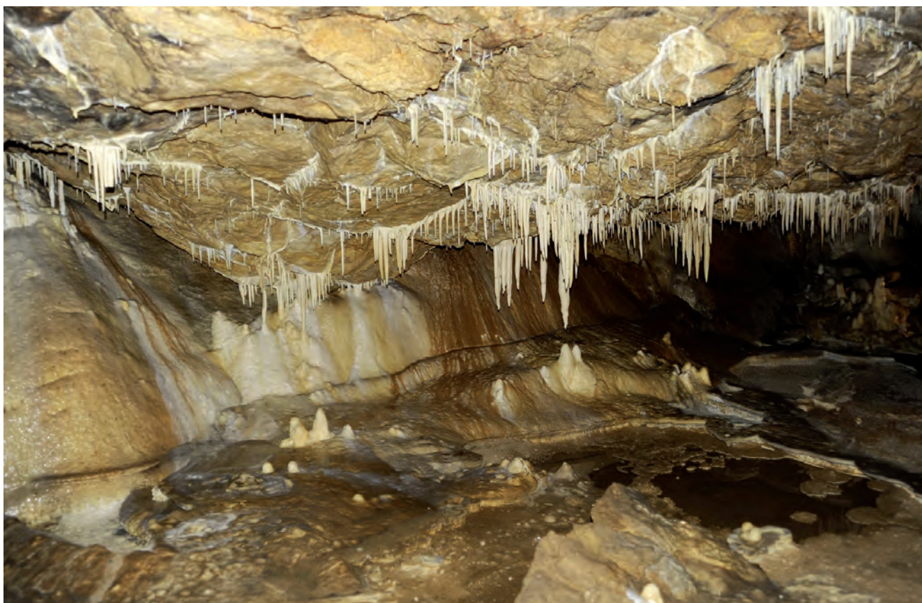
Fig. 3. Dripstone forms in Bear Cave • Formy naciekowe w Jaskini Niedźwiedziej

It was also included in the extent of the Śnieżnik Landscape Park established on 28 October 1981. On 11 June 1983, at 11.00 the cave was opened for tourism.