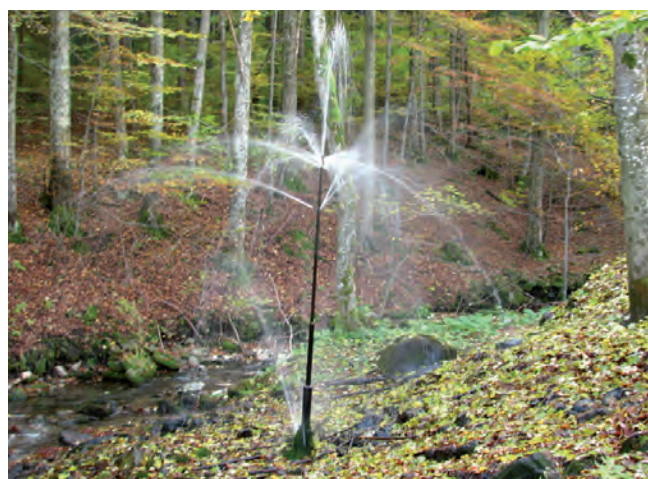
Fig. 5. Marianna Spring in Kleśnica Valley • Źródło Marianna w Dolinie Kleśnicy