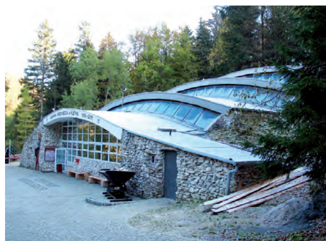
Fig. 2. Hall of Bear Cave in Kletno, phot. A. Marek • Pawilon Jaskini Niedźwiedziej w Kletnie, fot. A. Marek

Among the numerous natural assets of the Kleśnica Valley, geological forms which owe their formation to the karst phenomena are noteworthy. The most important of these is the Bear Cave (Fig. 2) open to tourists (see Bartuś et al. , 2012).