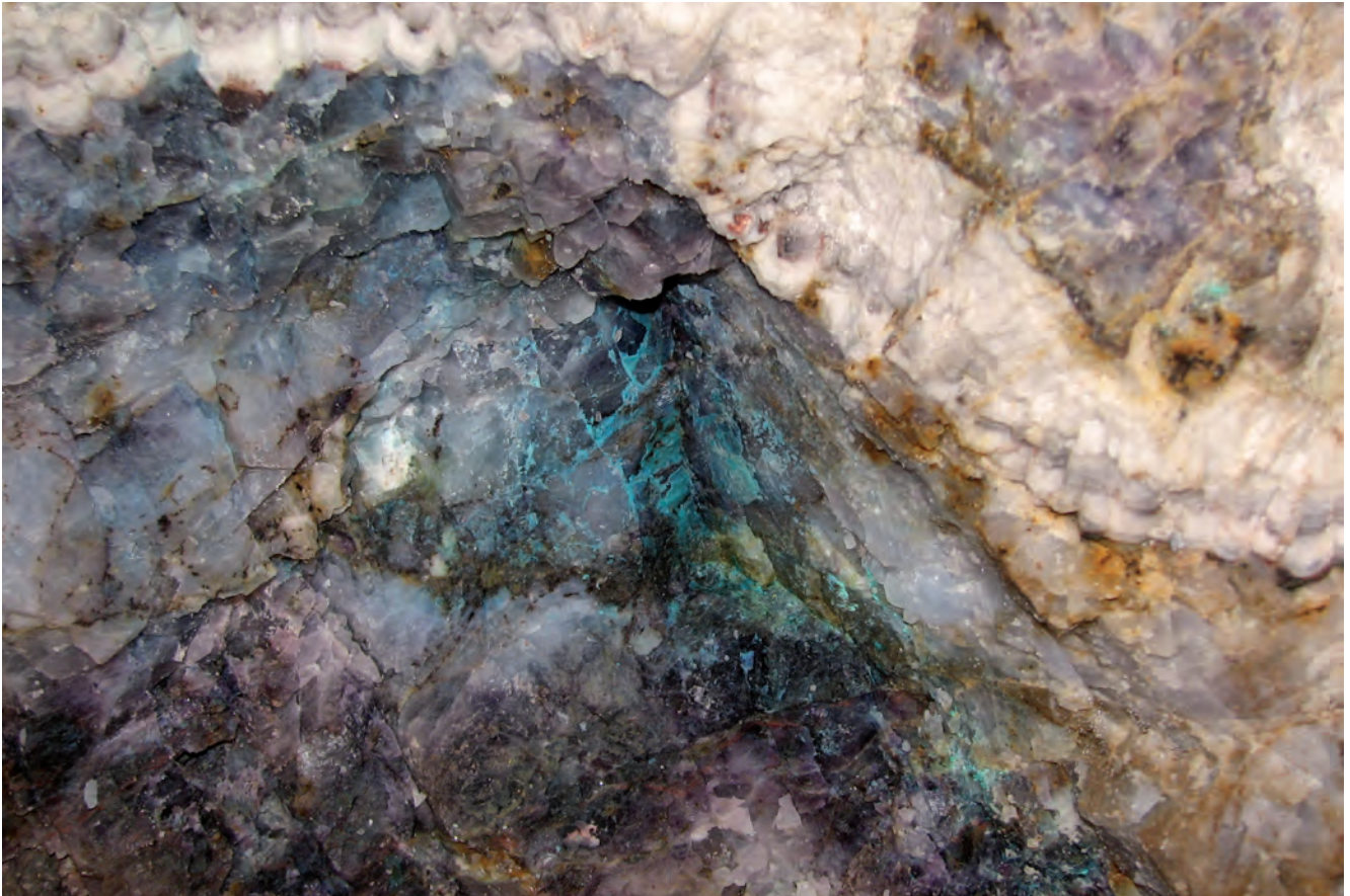
Fig. 9. Chrysocolla and fluorite from the fluorite adit • Chryzokola i fluoryt ze sztolni fluorytowej