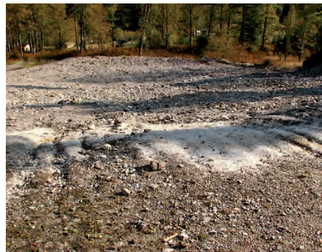
Fig. 8. Spoil-heap in Kletno • Hałda w Kletnie