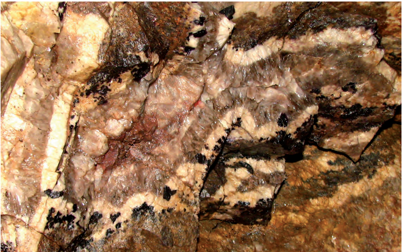
Fig. 10. Quartz (milky and smoky) and hematite from fluorite adit • Kwarc (mleczny i dymny) i hematyt ze sztolni fluorytowej