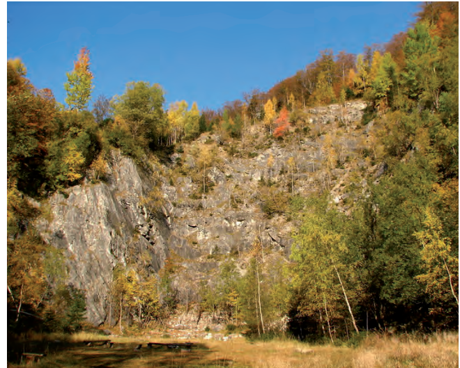
Fig. 6. Kletno II – abandoned marble quarry • Kletno II – nieczynny kamieniołom marmuru

The “Gracious Stone” lime kiln is located in the lower section of the Kleśnica Valley, near the old marble quarries (Fig. 11). The lime kiln was used for the burning of lime at a high temperature. It belonged to the estate of Marianne of Orange and was probably constructed in the early 19th century, in place of an old lime kiln. It was built on the plan of a hexagon as the work of the famous architect Karl Friedrich Schinkel.