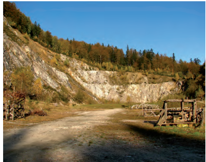
Fig. 7. Kletno I – abandoned marble quarry • Kletno I – nieczynny kamieniołom marmuru