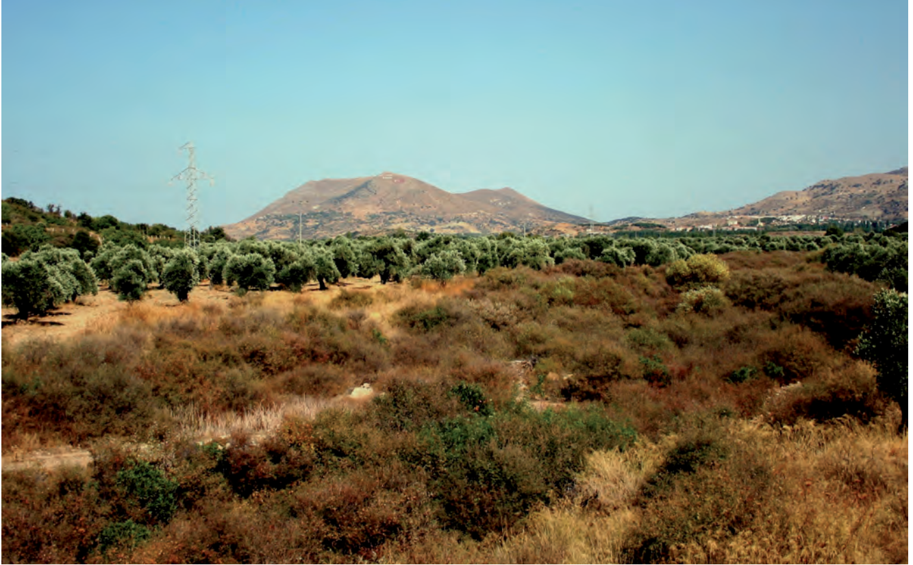
Fig. 9. Zeytinliköy – olive grove of several years • Zeytinliköy – od wielu lat prowadzona plantacja drzew oliwnych