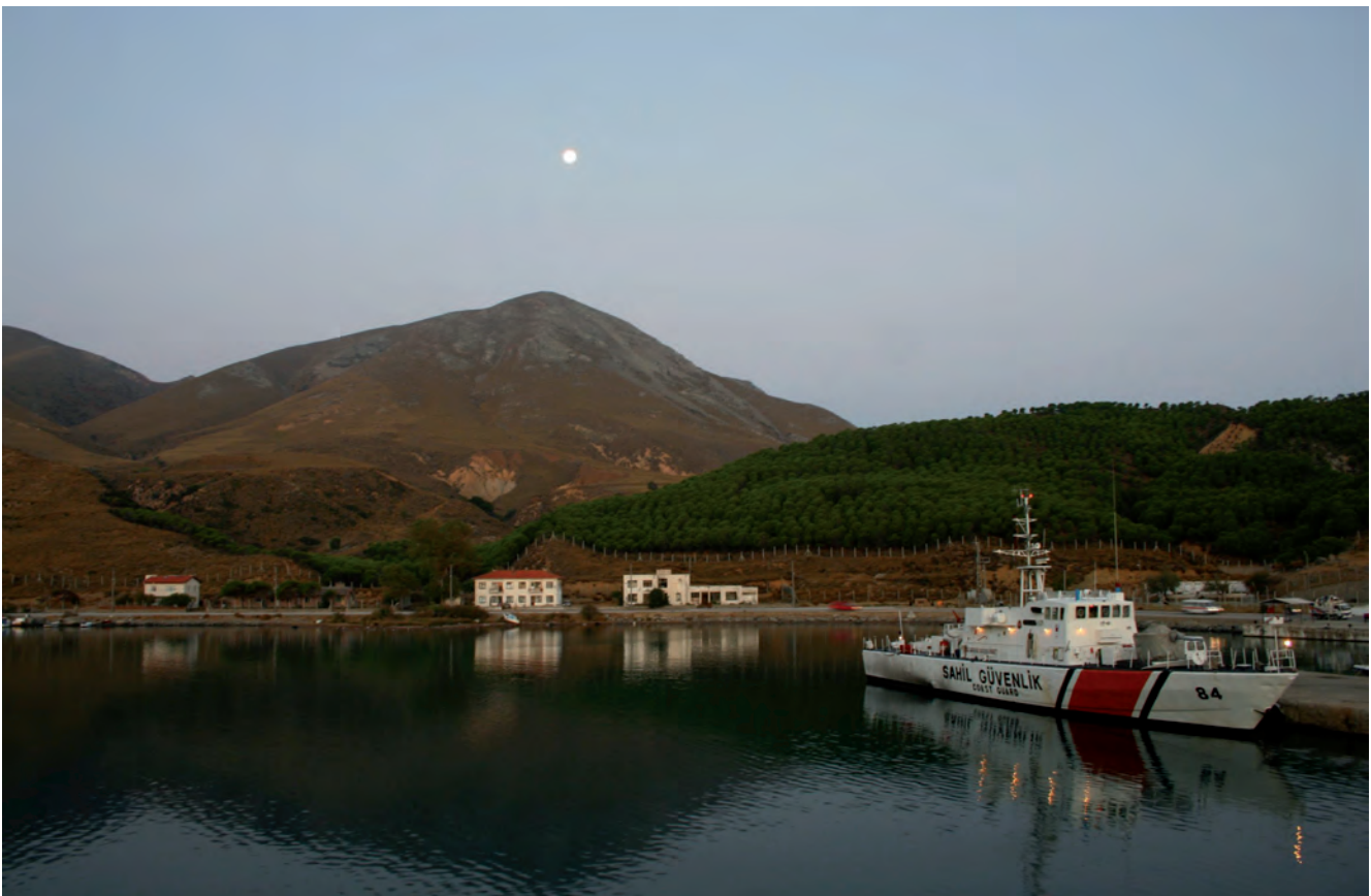
Fig. 2. Kuzulimanı – ferry harbour at dawn, phot. M.W. Lorenc • Kuzulimanı – przystań promowa o świcie, fot. M.W. Lorenc

The oldest history of Gökçeada has not been discovered entirely yet. Archaeologists pin high hopes on completing excavations which have been carried out systematically from 1996 on Yeribademli Höyük hill. The discoveries carried out up to now indicate that colonization here dates back to the time of Troy I but there are traces of older colonization dated back to 3000 BC. At the same time excavations carried out on Crete in Knossos have confirmed that the old Greek name of the island – Imvros was known in the second millennium BC.