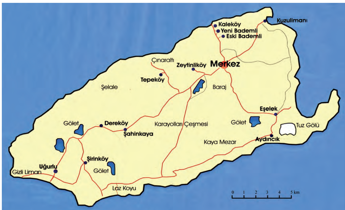
Fig. 1. Map of the Gökçeada (according to Gökçeada, 2002) • Mapa wyspy Gökçeada (wg Gökçeada, 2002)

Abstract: Gökçeada is the biggest of all Turkish islands situated on the Thracian Sea about 20 km west of the Gallipoli Peninsula. Archaeological discoveries have so far indicated that colonization on this island dates back to 3000 BC. Currently, about 8300 people live on Gökçeada, including about 250 inhabitants of Greek origin. The diversity of the island's geological structure affects its rich relief and area colouring. Cliffs on the northern coast and beaches on the southern one, high mountains and deep canyons in the central part of the island attract fans of solitude, diving and nature. Monuments from the time of the Roman Empire are rare on the island. One of them is a huge rock with two tombs hewn out in it. It is located in a completely uninhabited and treeless area.