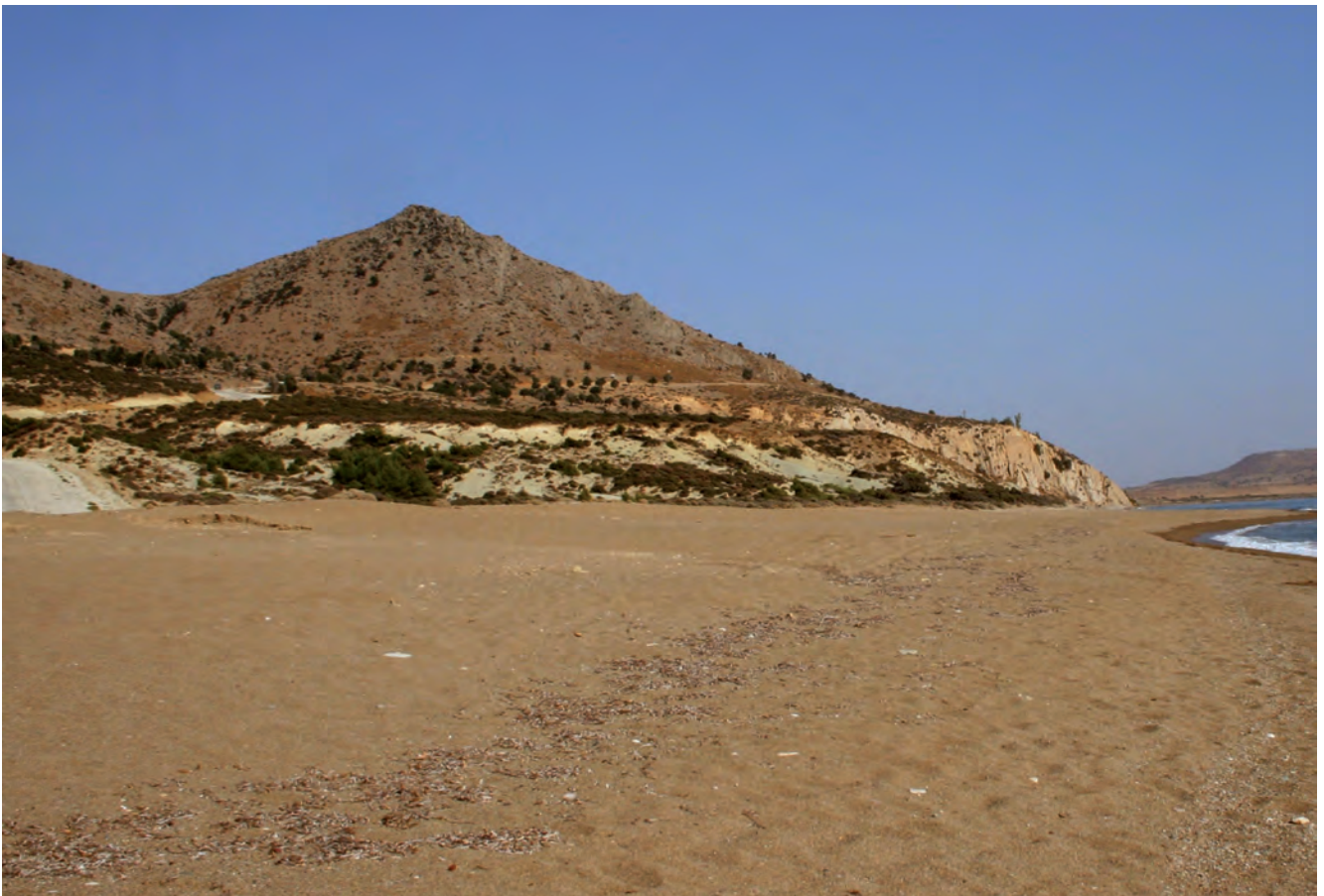
Fig. 10. Uğurlu – beaches of the southern coast • Uğurlu – plażowe południowe wybrzeże wyspy