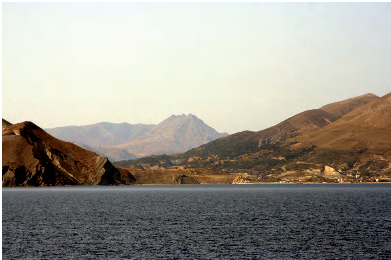
Fig. 6. Kuzulimanı – rocky coast of sandstones with andesitic dome in the background, phot. M.W. Lorenc • Kuzulimanı – skaliste piaszkowcowe wybrzeże z andezytową kopułą w tle, fot. M.W. Lorenc

When approaching Gökçeada by ferry, the place may seem an inhospitable and rocky island. In reality, it is beautiful and green in a large part. A visit to Gökçeada leaves unforgettable impressions.