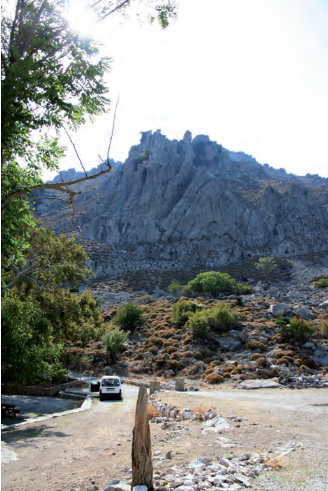
Fig. 4. Eski Bademli – andesitic dome, phot. M.W. Lorenc • Eski Bademli – kopuła andezytowa, fot. M.W. Lorenc

Nummulitic lenses of 5cm thickness are visible to the naked eye. Limestones particularly rich in nummulites ( Nummulites perforatus , Nummulites irregularis ) become violet. Locally it is also possible to find big oyster fossils ( Ostrea gigantea ) of diameter up to 15 cm in limestones. At the south-east border of the limestone area there are claystones and marls of thickness up to 400 m (Akartuna, 1980).