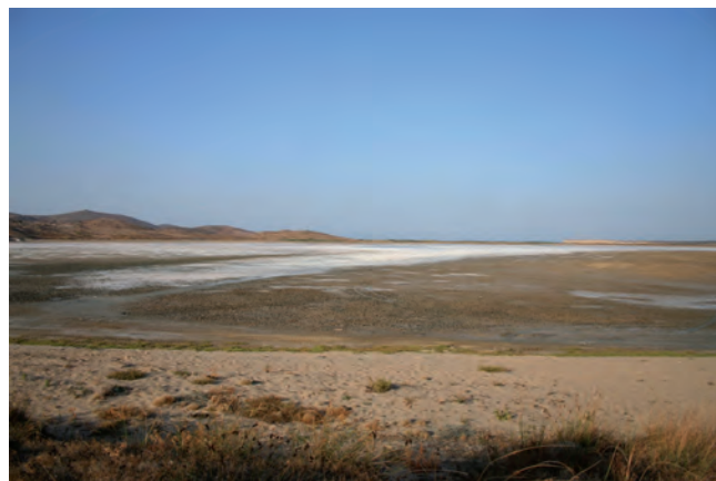
Fig. 12. Aydıncık – therapeutic mud of the salty lake • Aydıncık – terapeutyczny muł słonego jeziora

Going round the island further to the east, we will come across a place (although it can be easily overlooked) of a great historical value in the area of Kokina, 18 km away from Merkez. On a completely uninhabited and treeless ground there is a big piece of conglomerate with two tombs hewn out in it (Fig. 11). This object is dated back to the time of the Roman Empire.