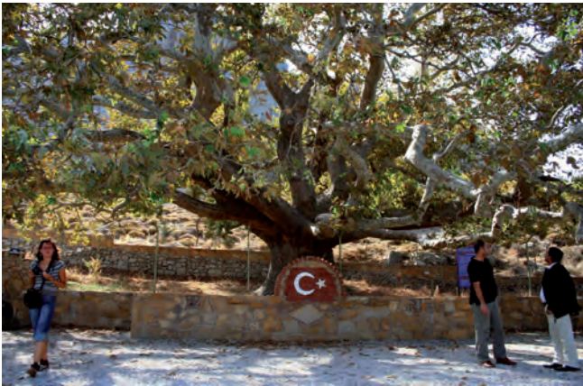
Fig. 7. Eski Bademli – plane tree – 630 years old natural monument • Eski Bademli – platan – pomnik przyrody liczący około 630 lat

There are seven old trees registered as monuments of nature. All of them are plane trees, the youngest ones are 180 years old and others are 400 years old. The oldest tree (Fig. 7) is