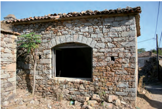
Fig. 5. Dereköy – building made from well fit blocks of andesite • Dereköy – budynek wykonany z dobrze dopasowanych bloków andezytu

The sedimentary formation of clastic rocks mainly consists of sandstones, slates and conglomerates which are revealed in the central part of the island. These sediments were deposited on limestones after marine regression in the Eocene. Cross stratification and current structures clearly visible in these rocks (including thick conglomerates) indicate sedimentation in the river or delta environment. Thicker horizons of lignite in this formation also support the fluvatile paleoenvironment. The thickness of this whole clastic formation reaches up to 1 km.