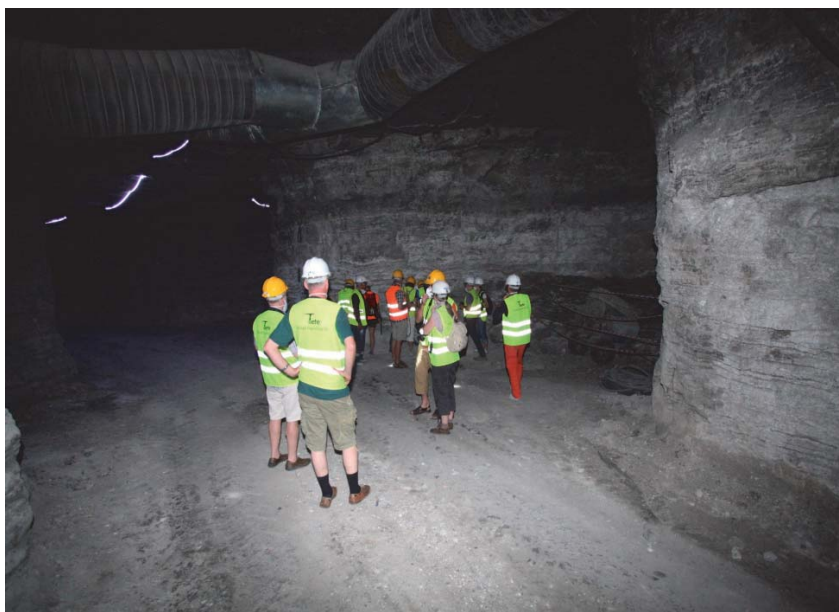
Fig. 5. Kopalnia siarczanów sodu Çayirhan

Basen Beypazari leżący w środkowej Anatolii wypełnia formacja środkowego i górnego miocenu o miąższości 1200 m, składająca się z osadów klastycznych, ewaporatów, węglanów i kompleksów skał wulkanicznych (Ortí et al. 2002). Najmłodszą jej jednostką jest formacja Kirmir o miąższości 250 m, leżąca w środkowej części basenu. Utworzyła się w środowisku płytkowodnym jezior słonych. Składają się na nią człony: gipsowo-iłowcowy, ewaporatowy z siarczanami sodu i iłowcowy. Człon ewaporatowy o miąższości sięgającej do 100 m zbudowany jest z warstw glauberytu ( \text{Na}_2\text{SO}_4 \cdot \text{CaSO}_4 ), mirabilitu ( \text{Na}_2\text{SO}_4 \cdot 10\text{H}_2\text{O} ) i tenardytu ( \text{Na}_2\text{SO}_4 ) – wydobywanych ze złoża Çayirhan. Eksploatacja prowadzona jest metodą ługowniczą w płytkiej kopalni podziemnej (Fig. 5).