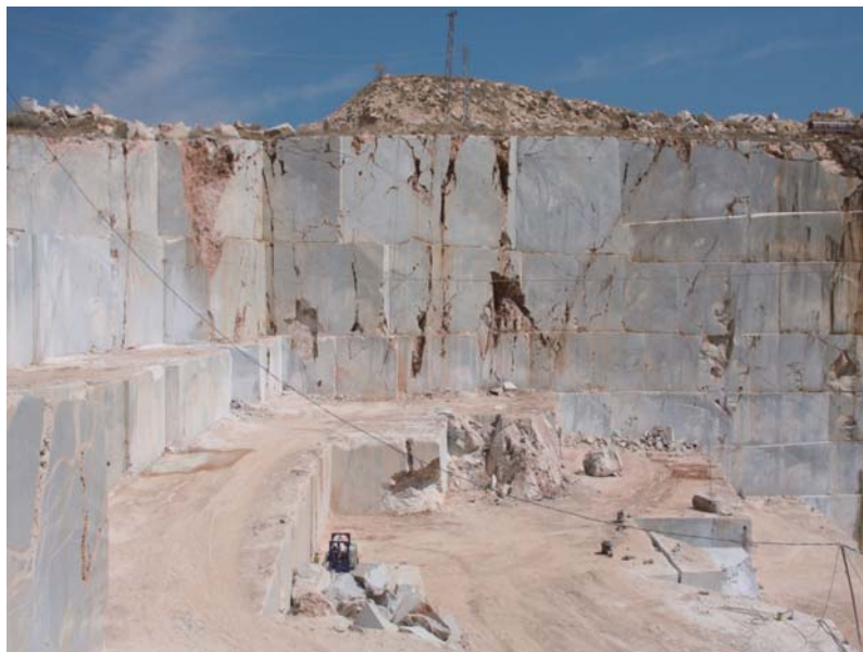
Fig. 7. Złoże marmuru w rejonie Iscehisar – Afyon

marmuru o rynkowych nazwach: Afyon White, Afyon Sugar, Tigerskin i in. W prowincji Afyon znajduje się 3,5% krajowych zasobów marmuru i wytwarza się tu 9% produkcji marmuru w blokach (Fig. 7).