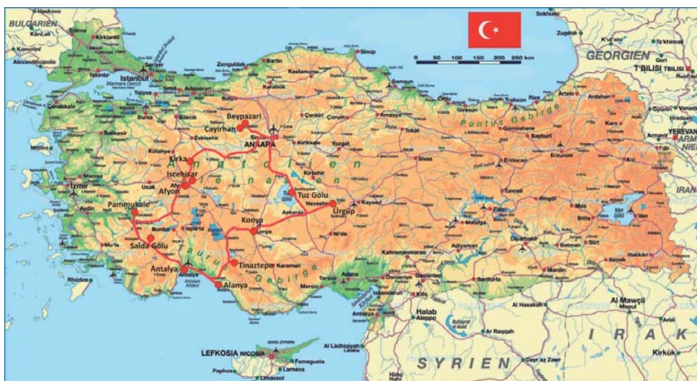
Fig. 1. Seminarium geologiczno-górnicze PSGS w Turcji – trasa przejazdu