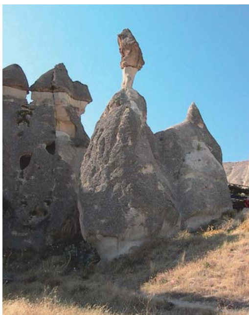
Fig. 8. Krajobraz Kapadocji Fig. 8. Landscape of Cappadocia