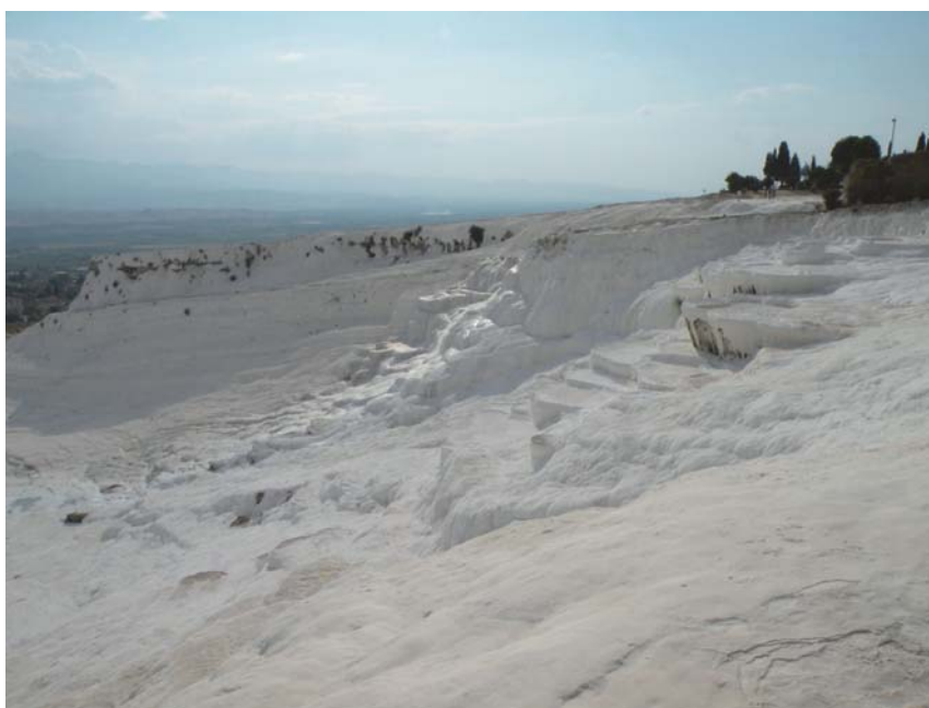
Fig. 6. Wytrącanie się trawertynu, Pamukkale (fot. W. Andrusikiewicz)

powierzchnię około 10 km 2 . Powstają tu od przynajmniej 400 000 lat i częściowo pokryły ruiny starożytnego frygijskiego miasta Hierapolis. System hydrotermalny Pamukkale tworzą wielowarstwowe połączone tektonicznie poziomy wodonośne w różnowiekowych skałach węglanowych, zasilane wodami opadowymi (Dilsiz et al. 2004). Podziemna migracja wód, gradient geotermiczny, rozpuszczanie węglanów, prawdopodobny kontakt z wodami hydrotermalnymi – stanowią mechanizm powstawania na tym obszarze gorących źródeł z wodami wzbogaconymi w jony wapnia, magnezu i węglanowe. Obszar, na którym powstają białe trawertyny w Pamukkale, objęty jest ochroną i figuruje na liście UNESCO Światowego Dziedzictwa Przyrodniczego.