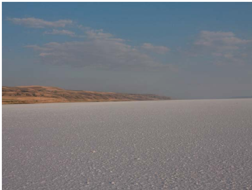
Fig. 3. Słone jezioro Tuz

Basen słonego jeziora Tuz (Fig. 3) leży w środkowej Anatolii i zajmuje 16 000 km 2 (Kýlýç & Kýlýç 2005). Stanowi on zespół typu „playa-lake” otoczony wyżynami. Jest to pozostałość po rozległym śródlądowym jeziorze, które pokrywało pomiędzy 23 tys., a 17 tys. lat temu basen Konya. Jezioro Tuz zajmujące obecnie powierzchnię około 1600 km 2 zasilane jest przez trzy rzeki i kilka okresowych strumieni. Jego główna część zachodnia jest płytsza – na wiosnę głębokość wód dochodzi do 0.7 m, ale potem jezioro wysycha. W części wschodniej, głębszej, wody o głębokości powyżej 1 m na wiosnę utrzymują się cały rok. Jezioro jest alkaliczne (pH 7–8), jednakże jego chemizm zmienia się w różnych strefach. W jego wodach występują jony: Na, Ca, Mg, K, siarczanowe i chlorkowe. Ponad połowa zapotrzebowania na sól w Turcji zaspokajana jest solą produkowaną w panwiach solnych na obrzeżach jeziora.