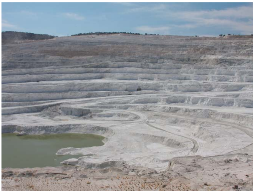
Fig. 4. Złoże boraksu Kirka

Obszar występowania złóż boranów w zachodniej Anatolii stanowi pas o długości 300 km w kierunku W-E i 150 km w kierunku N-S. Leżą tu złoża: Kirka, Emet, Kestelek, Bigadiç i Sultançayır, przy czym cztery pierwsze są eksploatowane (Helvacı & Ortı 2004). Są to złoża mioceńskie powstałe jako osady okresowych słonych jezior. Wulkaniczno-sedymentacyjna sekwencja wypełniająca rozległy basen sedymentacyjny składa się ze skał wulkanicznych, dwóch serii boranowych, tufów i bazaltów. Spoczywa ona na podłożu zbudowanym z metamorficznych skał paleozoicznych, ofiolitów mezozoicznych i wapieni eocenu. Poszczególne złoża różnią się składem mineralogicznym: w złożu Bigadiç wydobywa się kolemanit ( \text{CaB}_3\text{O}_4(\text{OH})_3 \cdot \text{H}_2\text{O} ) i uleksyt ( \text{NaCaB}_5\text{O}_6(\text{OH})_6 \cdot 5\text{H}_2\text{O} ), w złożu Kestelek i Emet – kolemanit, a w złożu Kirka – boraks (tinkal) ( \text{Na}_2\text{B}_4\text{O}_7(\text{OH})_4 \cdot 8\text{H}_2\text{O} ). Złoże boranów Kirka jest jednym z największych na świecie. Miąższość serii boranowej równa jest 70 m, a lokalnie osiąga 145 m. Grubość nadkładu sięga około 200 m. Wydobycie prowadzi się w kopalni odkrywkowej (Fig. 4). Głównymi minerałami złoża przemysłowego są: boraks, uleksyt i kolemanit. Zawartość \text{B}_2\text{O}_3 w złożu wynosi 20–25%.