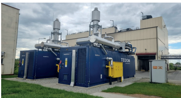
Rys. 2. Dwie nowe jednostki kogeneracyjne – każda o mocy 800 kW

Biogaz zasila jednostki kogeneracyjne, może również służyć jako paliwo dla kotłowni gazowej. Trzy jednostki kotłowe mogą być zasilane zarówno biogazem, jak i gazem ziemnym. Oczyszczalnia Płaszów posiada cztery jednostki kogeneracyjne – każda o mocy elektrycznej 800 kW. Dwie z nich umiejscowiono w budynku energetycznym, gdzie są podłączone do rozdzielni głównej niskiego napięcia, natomiast dwie nowe 1 , w formie wolnostojącej, są podłączone poprzez stację transformatorową 0,4/15 kV do rozdzielni głównej średniego napięcia (Rys. 2).