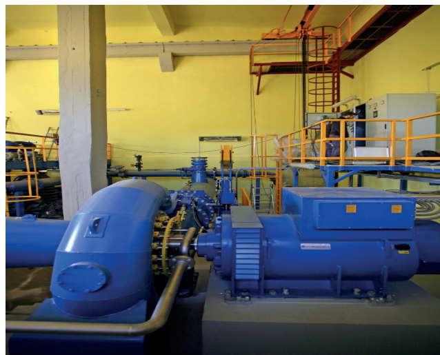
Rys. 8. Widok turbiny wraz z generatorem

moc przyłączeniową ok. 4 kW i zużywa ok. 300 kWh energii na miesiąc, to – uwzględniając współczynnik jednoczesności – nasza turbina może stanowić źródło zasilania dla ok. 100 takich gospodarstw.