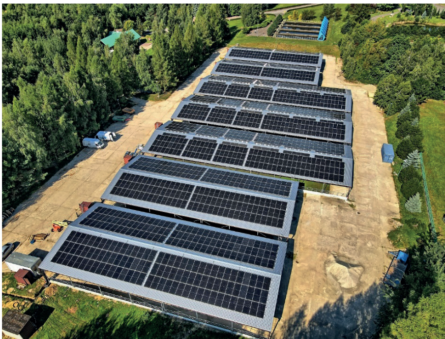
Rys. 9. Farma fotowoltaiczna o mocy 920 kWp

Niezależnie od budowy jednostek wytwórczych podejmowane są działania związane z ograniczeniem jednostkowego zużycia energii przez poszczególne jednostki pracujące w ciągach technologicznych. Jednym z takich działań jest modernizacja i wymiana urządzeń na takie, które zużywają mniej energii elektrycznej. Przykładem może być modernizacja linii technologicznej ozonowania wody w ZUW Raba, gdzie dzięki zmianie technologii wytwarzania ozonu oraz zastosowaniu nowoczesnych generatorów udało się ograniczyć zużycie energii elektrycznej o 94 kW w ciągu godziny, co miesięcznie daje oszczędność rzędu 68 MWh energii elektrycznej.