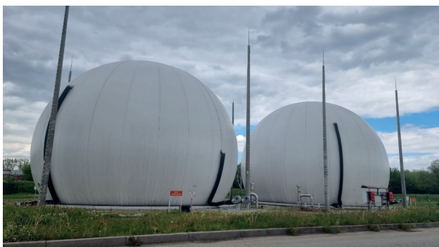
Rys. 1. Zbiorniki biogazu na terenie Oczyszczalni Płaszów

po uzdatnieniu surowiec może być bezpiecznie użyty do produkcji energii elektrycznej i ciepła.