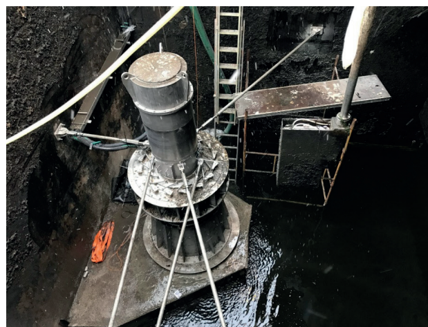
Rys. 4. Turbina zabudowana w komorze pomiarowej ścieków oczyszczonych

Odzyskując energię z oczyszczonych ścieków odprowadzanych do odbiornika, w ciągu roku turbina produkuje około 380 MWh energii elektrycznej. Biorąc pod uwagę przedstawione rozwiązania, można stwierdzić, że